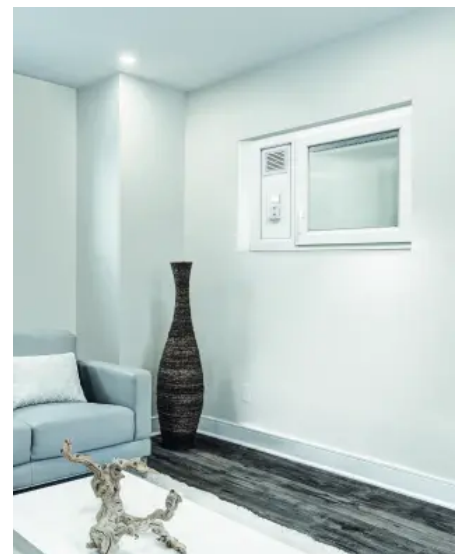
Optimale Belüftung ohne manuelles Öffnen des Fensters

Bei Vorhandensein einer MEALUXIT-Wechselzarge lassen sich Austauschflügel mit Lüfterfunktion problemlos nachrüsten.