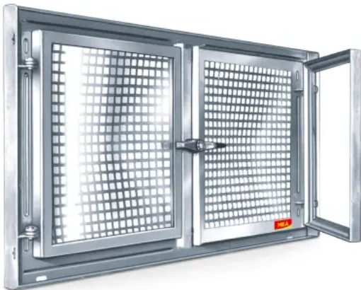
MEALIT zweiflügelig mit festem Mittelteil