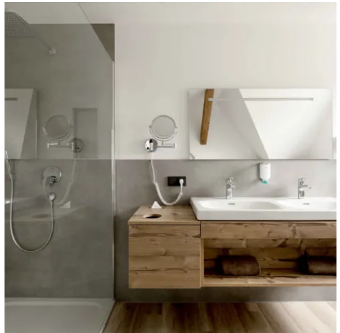
Landgasthaus Scheubel, Deutschland

Dekore 0085 Weiß, M003 Alu Edelstahlton, 0320 Sereno