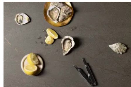
Fundermax Produkt Y111 AA Eldorado Granit Morastgrau