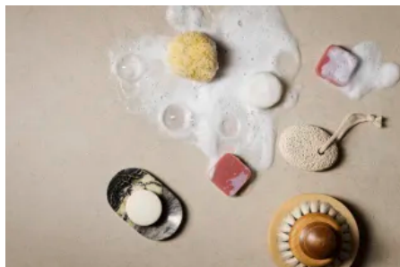
Fundermax Produkt 0985 GA Andromeda Stein Sand

Aus der Serie Dekorativer Möbel- und Innenausbau von Fundermax