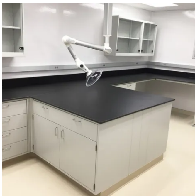
Engineering Smiles - mobile Zahnarztpraxis, USA

Weitere Technische Informationen zu Max Resistance 2 .