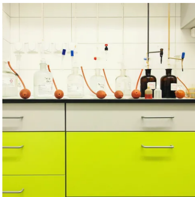
Labor in der Brauerei, Tschechien