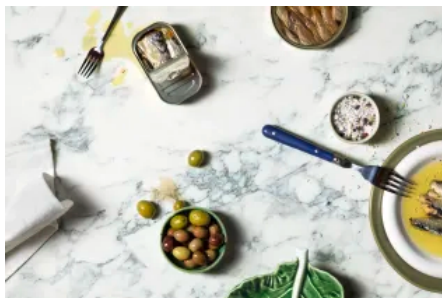
Fundermax Produkt 0966 AP Monumento Marmor Weiss