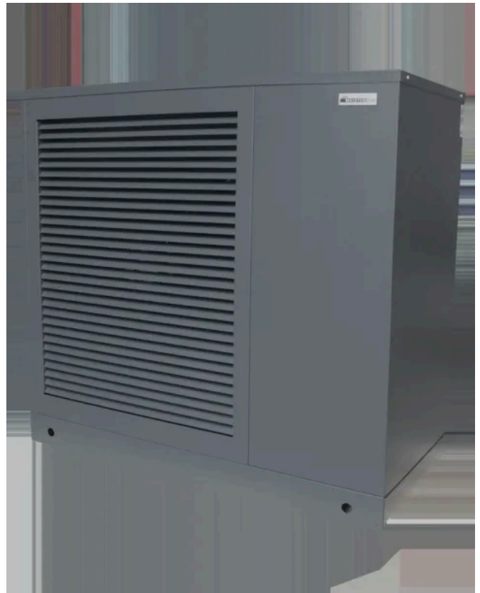
Luft-Wasser-Monoblock Wärmepumpe ecoWP Xe