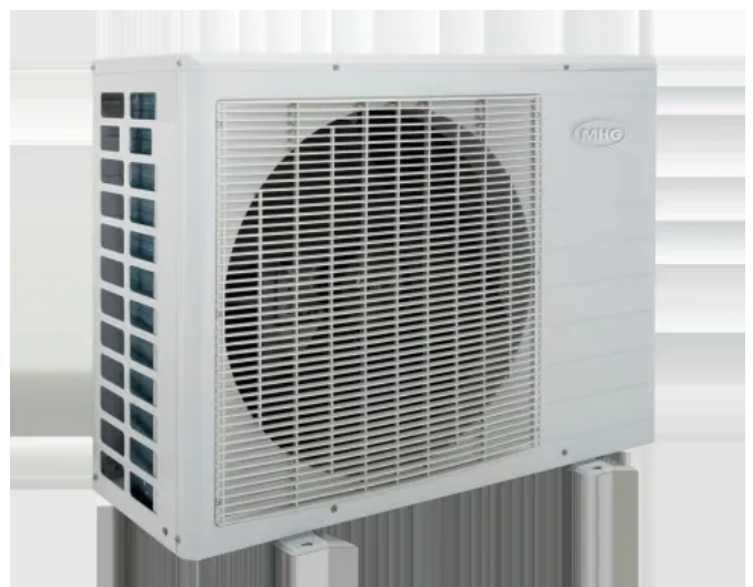
Luft-Wasser-Monoblock Wärmepumpe ecoWP Xm

Mit der ecoWP Xm erfüllen lassen sich diese Anforderung sicher und zuverlässig erfüllen. Die Wärmepumpe übernimmt den Großteil des Wärmebedarfs – die bestehende Heizung unterstützt nur bei Bedarf. So entsteht ein zukunftssicheres Hybridsystem, das die gesetzlichen Vorgaben erfüllt und Planungssicherheit für die kommenden Jahre bietet.