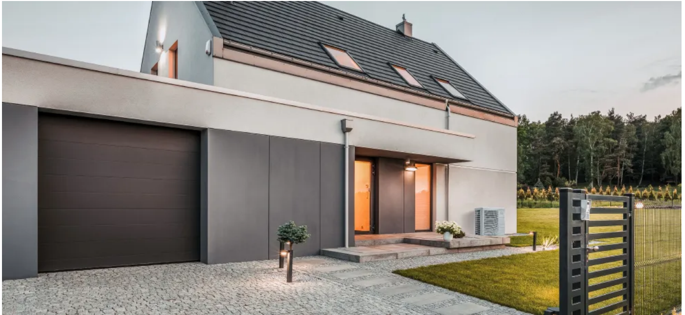
Luft-Wasser-Monoblock Wärmepumpe ecoWP Xm

Aus der Serie Luft-Wasser-Wärmepumpen von MHG HEIZTECHNIK