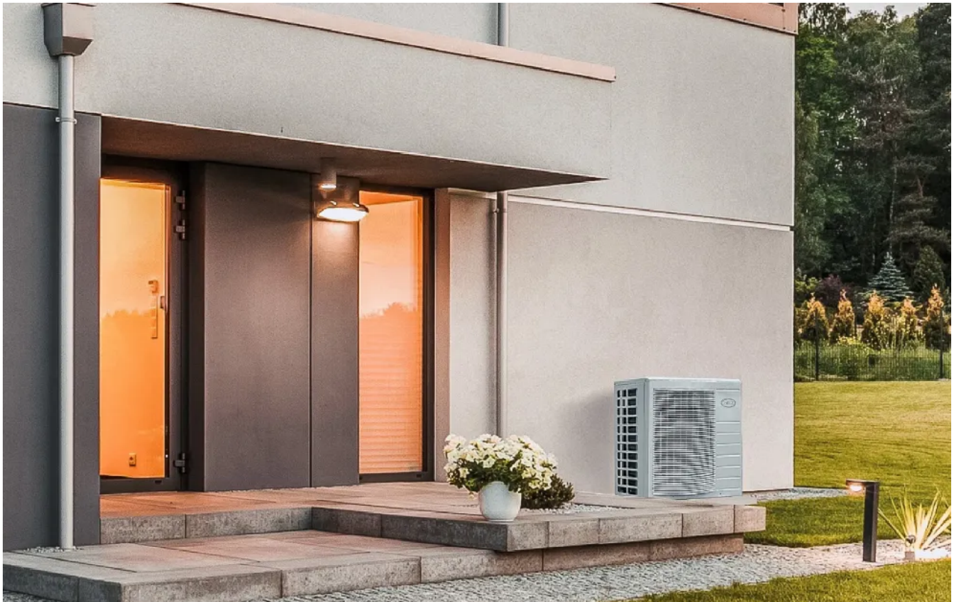
Luft-Wasser-Monoblock Wärmepumpe ecoWP Xm

Aus der Serie Luft-Wasser-Wärmepumpen von MHG HEIZTECHNIK