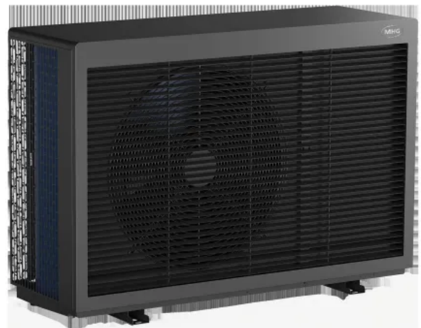
Luft-Wasser-Monoblock Wärmepumpe ecoWP 2Xe