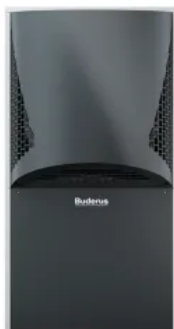
Logatherm WLW286 A

Mehr Informationen: Broschüre Logatherm WLW196i IR