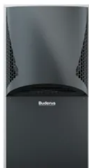
Logatherm WLW286 A

Mehr Informationen: Broschüre Logatherm WLW196i IR