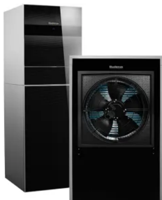
Logatherm WLW 196i IR

Aus der Serie Wärmepumpentechnik von Buderus