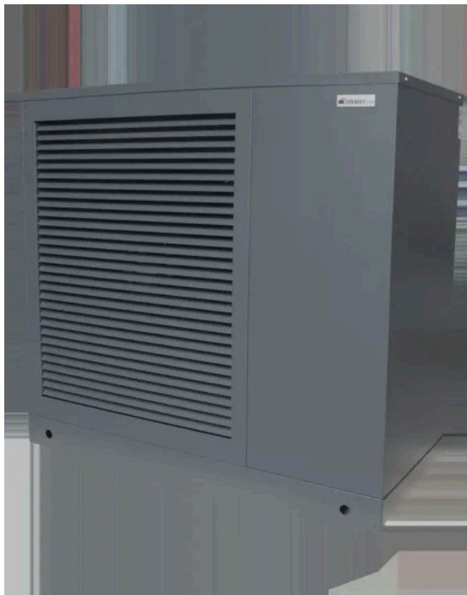
Luft-Wasser-Monoblock Wärmepumpe ecoWP Xe