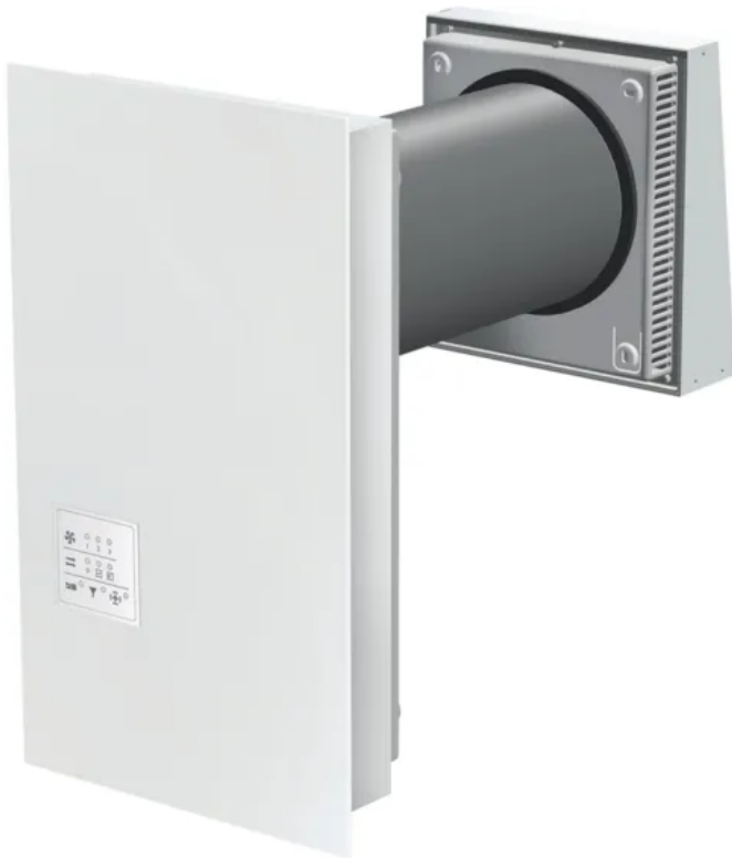
AirComfort R-Tube Standard

Neben den BTI Pendellüftungs-Systemen kommen auch Einzelraumgeräte zum Einsatz. D. h. diese Komplettsysteme fördern Zu- und Abluft gleichzeitig und benötigen kein weiteres gegenläufig arbeitendes Gerät. Einzelraumgeräte sind die Lüftungslösungen, wo die getrennte, einzelne Lüftung von Räumen, wie bspw. in Wohnheimen notwendig ist.