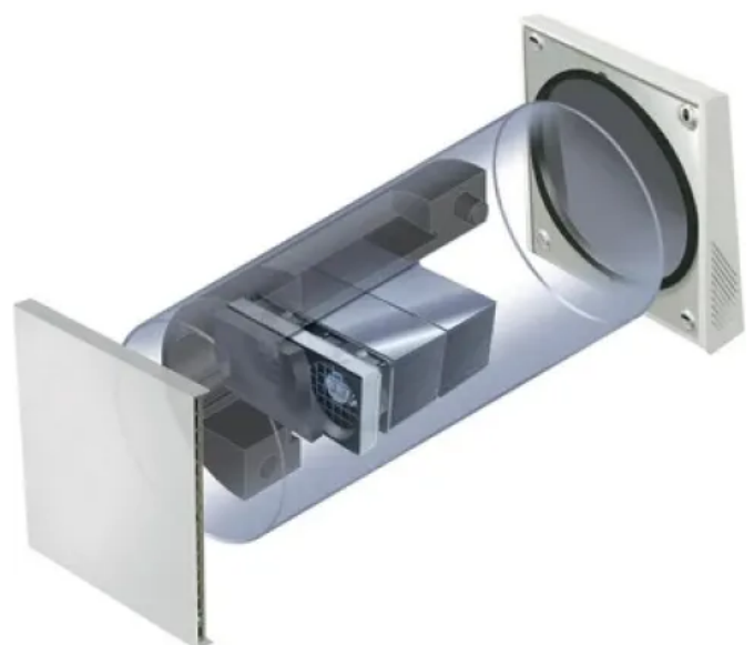
Air Comfort R