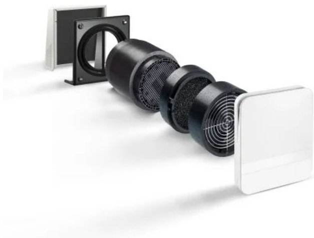
Lüfter der Serie e 2 mit Funkblende

Aus der Serie Lüftungssysteme für Wohngebäude von LUNOS Lüftungstechnik