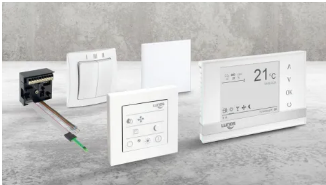
Steuerungen für Lunos Lüftungssysteme

Aus der Serie Lüftungssysteme für Wohngebäude von LUNOS Lüftungstechnik