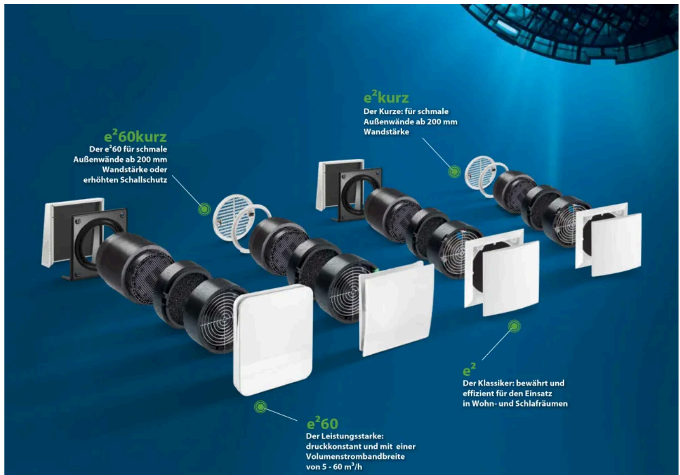
Lüfter der Serie e 2