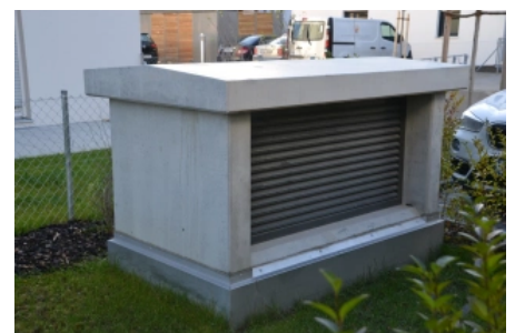
Lüftungsschacht als Betonfertigteile