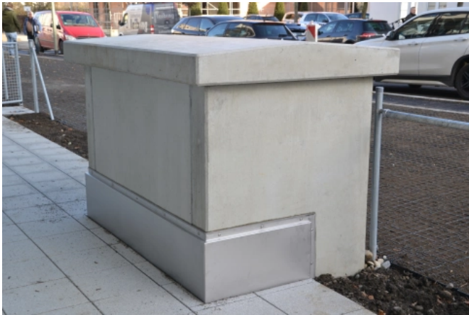
Lüftungseinhausung nach Maßvorgabe

Aus der Serie Kellerfenster und Schachtsysteme von HIEBER Betonfertigteilewerk