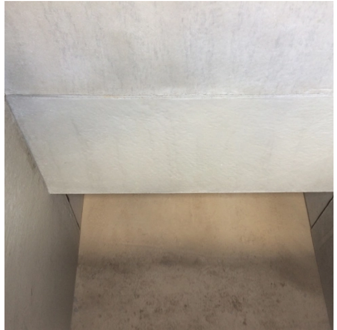
Die glatten Innenflächen verhindern Staubablagerungen und sind leicht zu reinigen.