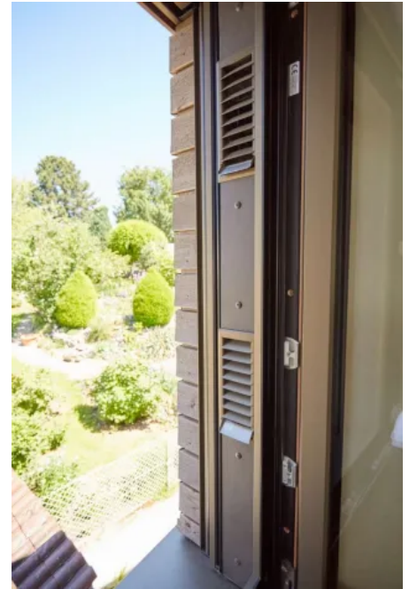
Detailansicht der Laibungslösung für die wohnungszentrale Lüftungsanlage.