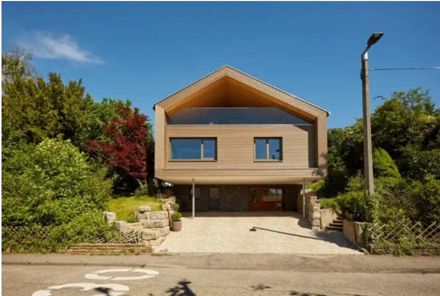
Das Lüftungssystem freeAir fügt sich nahtlos in das Gesamtkonzept ein.

Aus der Serie Wohnraumlüftung mit Wärmerückgewinnung von bluMartin