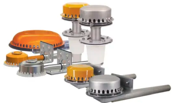
LORO für Dachentwässerung Druckströmung