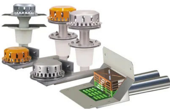
LORO für Dachentwässerung Freispiegelströmung