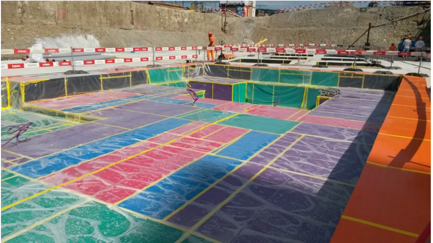
Anwendungsbeispiel - Vollflächige Gebäudelagerung

Aus der Serie Erschütterungsschutz durch elastische Gebäudelagerung von Getzner Werkstoffe