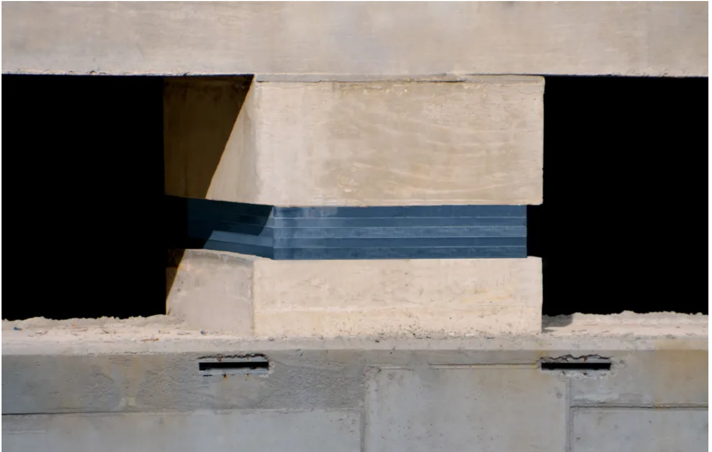
Anwendungsbeispiel - Punktförmige Gebäudelagerung

Aus der Serie Erschütterungsschutz durch elastische Gebäudelagerung von Getzner Werkstoffe