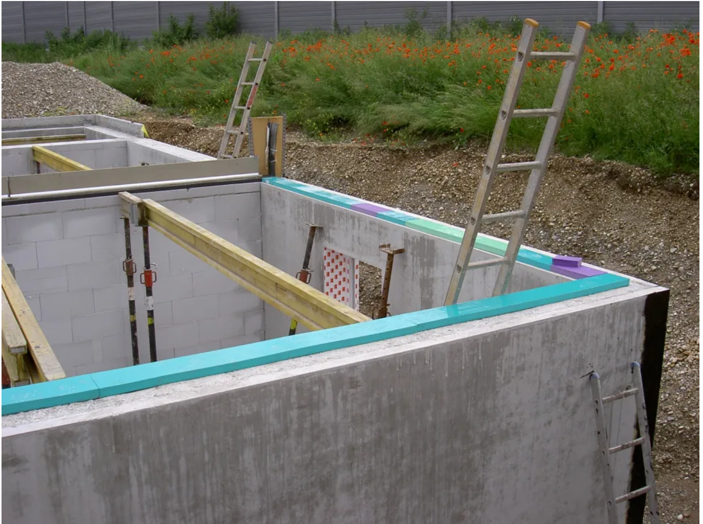
Anwendungsbeispiel - Streifenförmige Gebäudelagerung

Aus der Serie Erschütterungsschutz durch elastische Gebäudelagerung von Getzner Werkstoffe