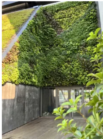
Port Event Center, Düsseldorf