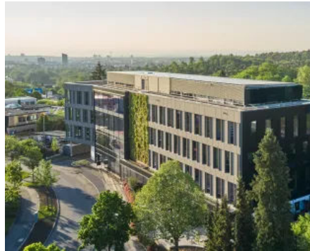
Drees & Sommer, Stuttgart