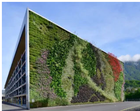
BLS Werkstätte Bönigen-Schweiz

Die LivingWALL verwandelt Fassaden in wertvollen Lebensraum und bildet eine vorgehängte, hinterlüftete Fassade. Mit ihrem innovativen Vlies-Substrat-System ermöglicht sie Pflanzenwachstum ohne direkten Kontakt zum Baukörper.