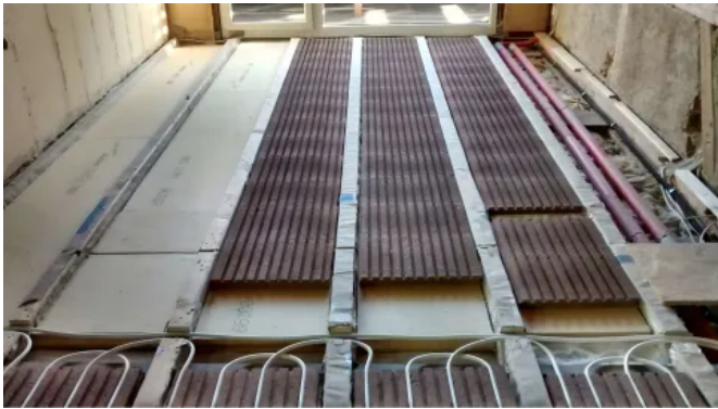
Die Lithotherm Formplatten können zwischen einer vorhandenen Balkenlage verlegt werden.

Aus der Serie LITHOTHERM®: Raum-Klima-System für Wand- und Fußbodenheizungen von Lithotherm Deutschland