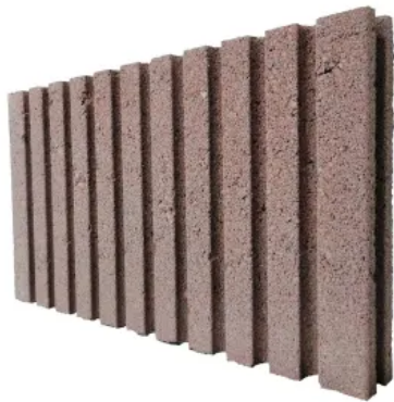
Formplatten aus Lavasplitt oder Kalksplitt- Blähton

Aus der Serie LITHOTHERM®: Raum-Klima-System für Wand- und Fußbodenheizungen von Lithotherm Deutschland