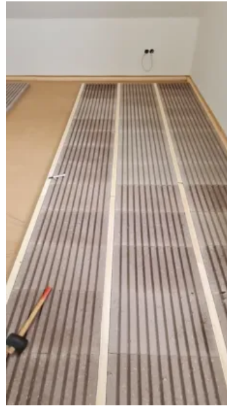
Auf den Holzprofileleisten wird der Dielenboden aufgeschraubt.