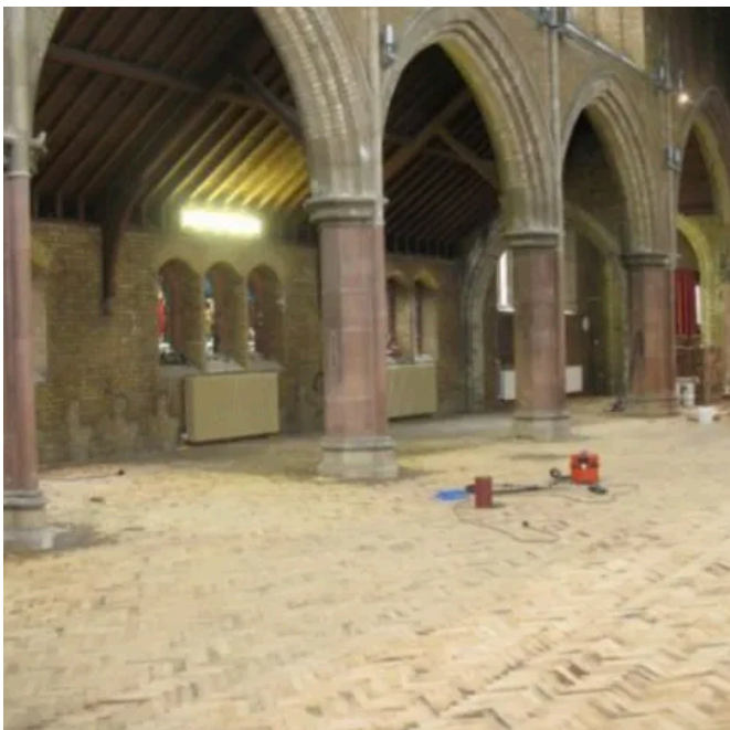
Abschluss der Bodenarbeiten. Der Parkettboden wird direkt auf dem Lithotherm System verlegt.