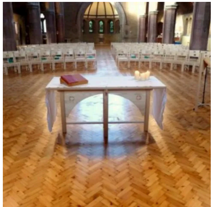
Fertiggestellter Bodenbelag auf dem Lithotherm-System – Altarbereich und Bestuhlung im sanierten Kirchenraum.