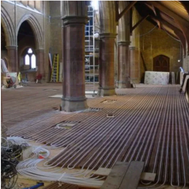
Installation der Lithotherm Trockenbau-Fußbodenheizung im historischen Kirchenschiff.

Aus der Serie LITHOTHERM®: Raum-Klima-System für Wand- und Fußbodenheizungen von Lithotherm Deutschland