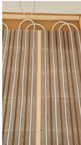
Das Lithotherm Systemrohr wird in die vorgefertigten Rillen eingelegt.