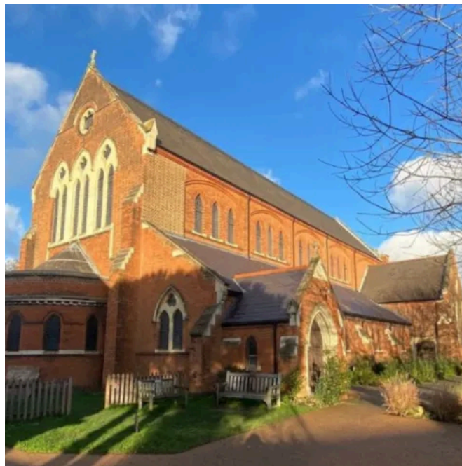
St. Thomas Church in London – ein historisches Bauwerk mit neugotischer Architektur.