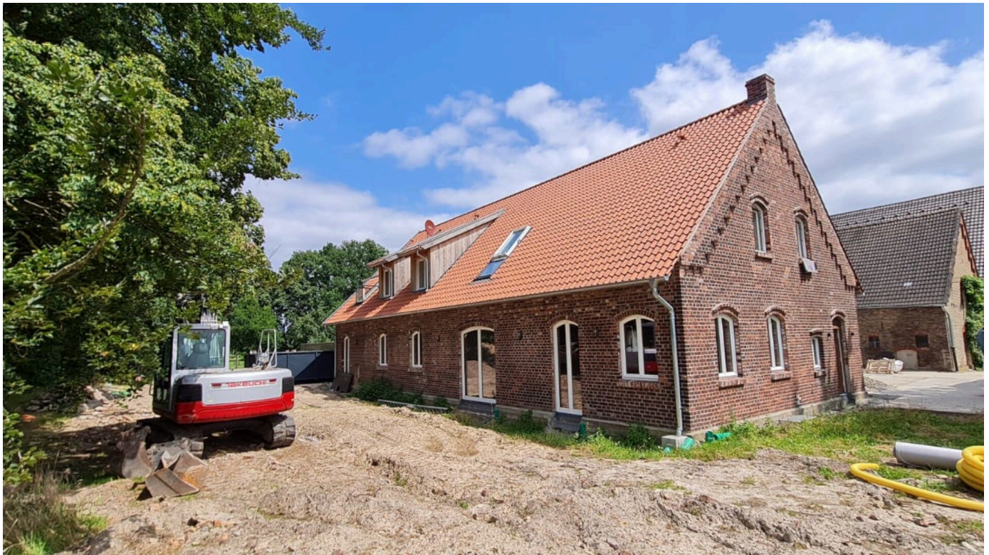
Trockenbausystem für Bestandssanierung

Aus der Serie LITHOTHERM®: Raum-Klima-System für Wand- und Fußbodenheizungen von Lithotherm Deutschland