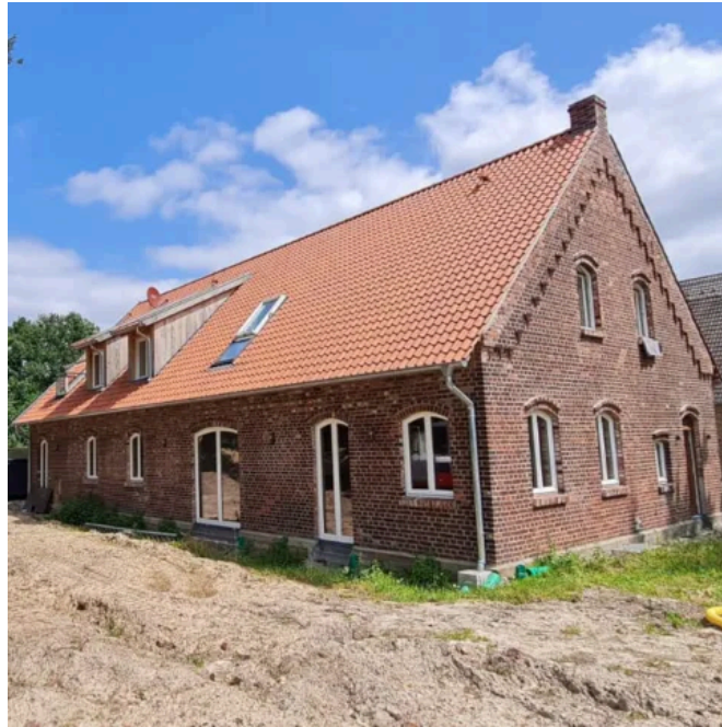
Umgenuetzter und sanierter Stall.