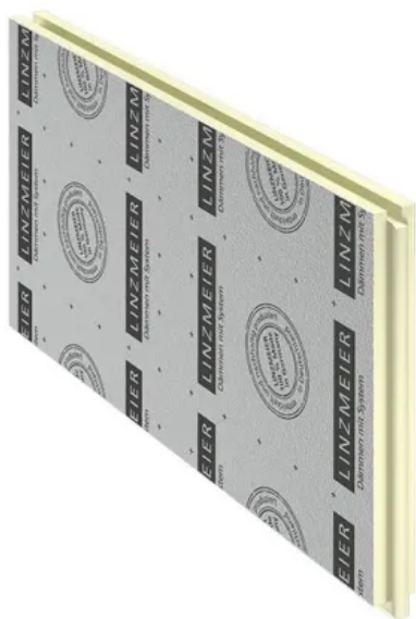
LINITHERM PAL Uni N+F