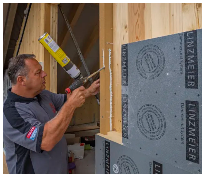
LINITHERM® PAL W