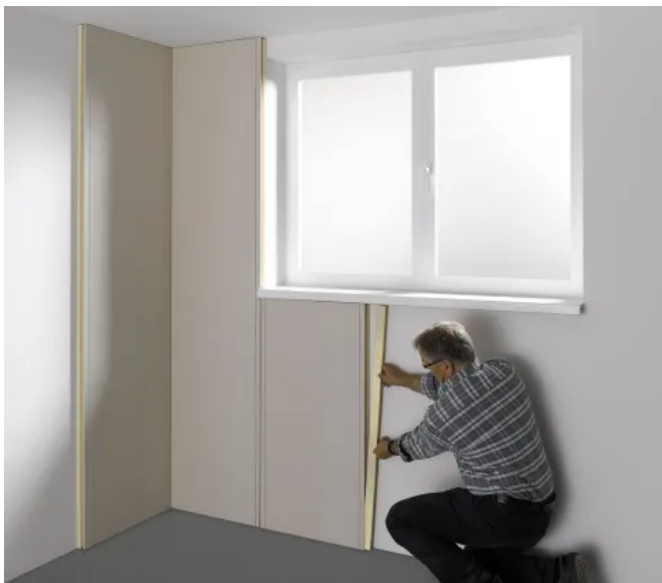
LINITHERM® PAL SIL, Dämmung der Außenwand von innen

Kanten: Umlaufend genutet für lose Sperrholz-Feder (im Lieferumfang enthalten), Silikatplatte mit Trockenbaukante.