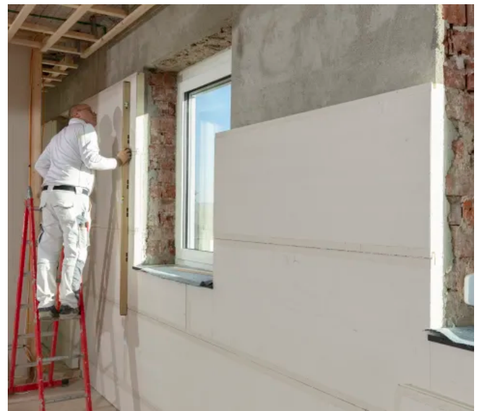
LINITHERM® PAL SIL, Dämmung der Außenwand von innen