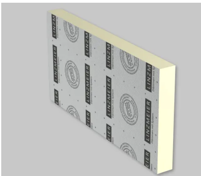
LINITHERM® PAL W