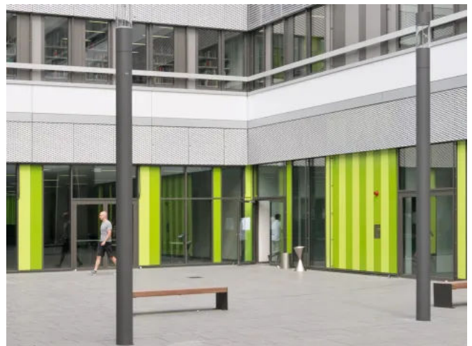
Fünf verschiedene Oberflächen sowie viele hundert Farbtöne und Dekore ermöglichen ein breites Gestaltungsspektrum