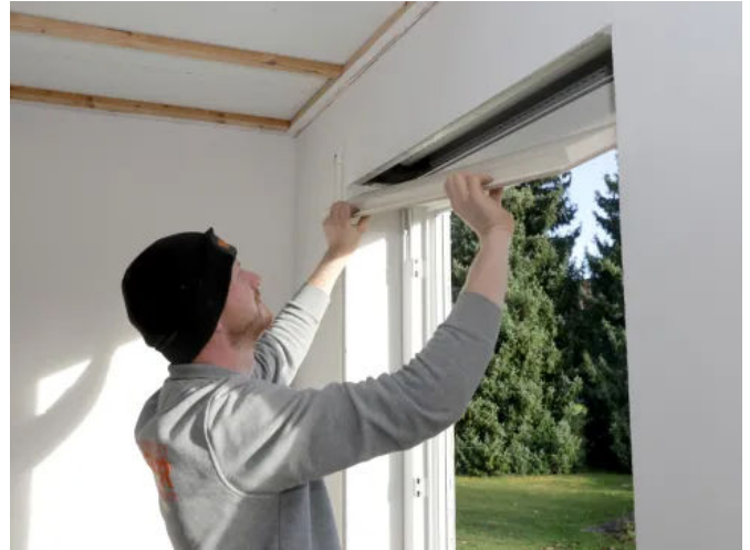
Einbau eines LINIT Rollladenkastendeckels in der Sanierung