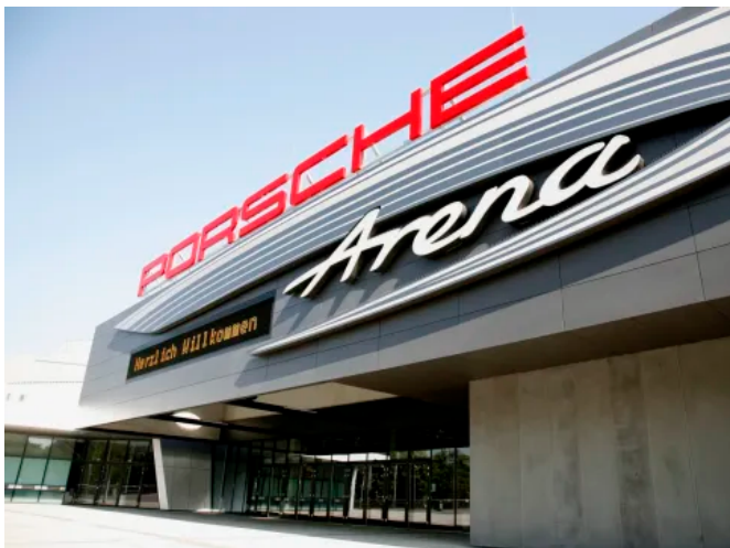
Die LINIT Verbundelemente eignen sich für den Außen- und Inneneinsatz.