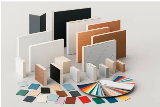
LINIT Standard-Verbundelemente / Sandwichelemente

LINIT bietet wirtschaftliche, nachhaltige und objektspezifisch konfigurierbare Verbund- und Sandwichelemente im Standardmaß, ausgeführt mit variablen Deckschichten und unterschiedlichen Dämmkernen.