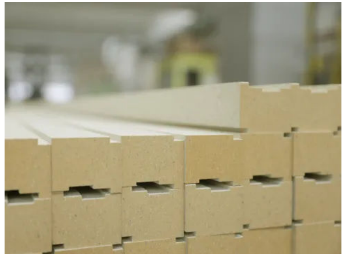
Die mechanisch hoch beständige LINIREC Werkstoffplatte lässt sich individuell sägen und fräsen