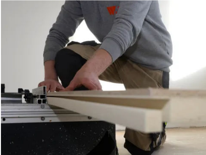
Die Rollladenkastendeckel werden entweder von LINIT nach Kundenwunsch gefräst, oder auf der Baustelle angepasst

der Aufbau angepasst werden. Die Deckschichten sind wahlweise unbehandelt (streich- oder tapezierfähig) oder weiß melaminharz bzw. PVC-folienbeschichtet lieferbar.