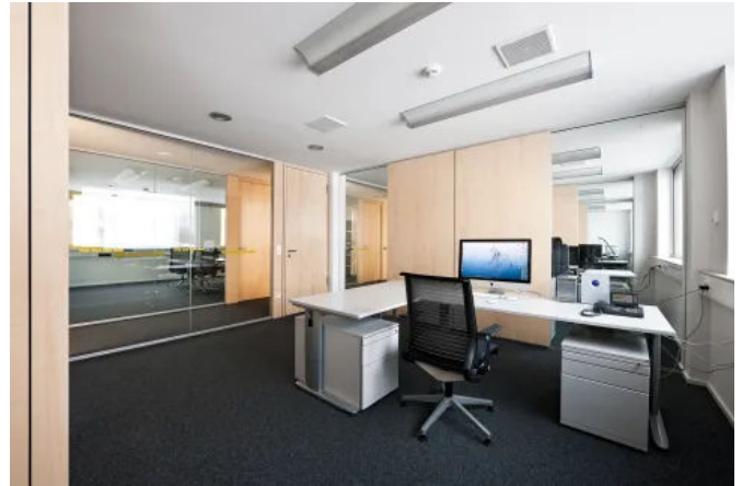
LINIT Verbundelemente mit Sperrholzdeckschicht im Inneneinsatz.

Mehr Informationen zu den Verbundelementen