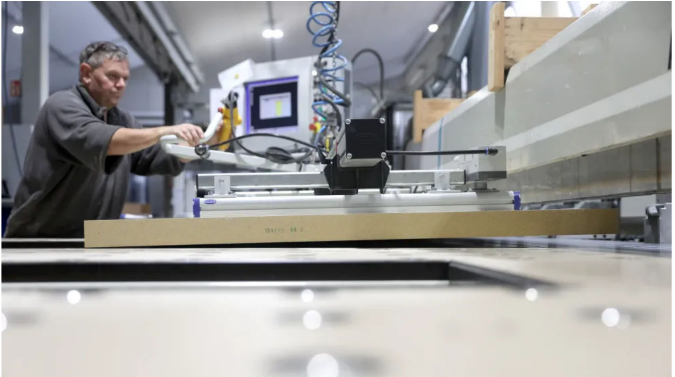
LINIT - Individuelle Zuschnitte

LINIT fertigt Zuschnitte und bearbeitet unterschiedliche Werkstoffe individuell nach Kundenwunsch