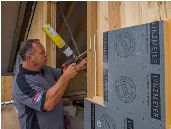
LINIREC für Tür- und Fensterlaibungen oder beim Fenster- und Bohleneinbau