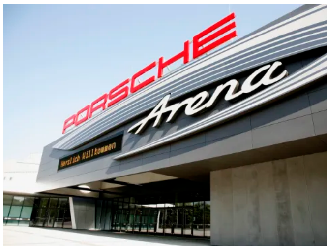
Die LINIT Verbundelemente eignen sich für den Außen- und Inneneinsatz.