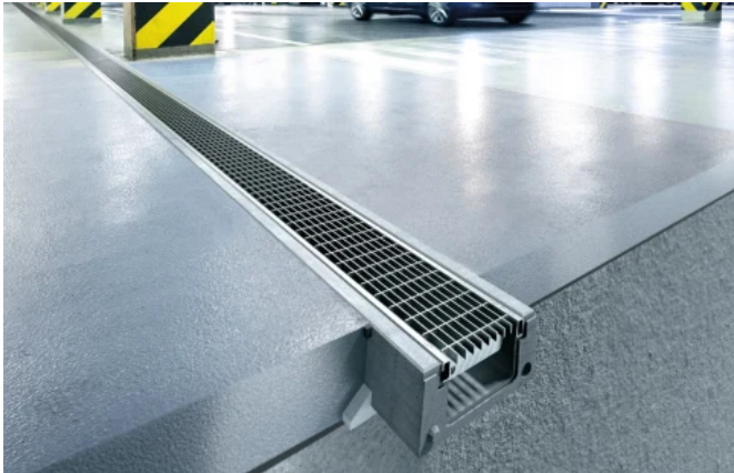
ACO DRAIN® Deckline P 100