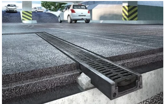
ACO DRAIN® Deckline P 100

ACO DRAIN® Deckline P 100: Weitere Herstellerinformationen