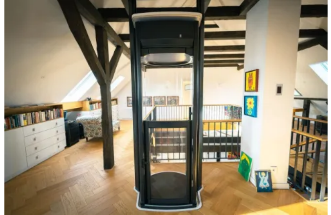
Homelift Lifton TRIO, Oberfläche schwarz foliert