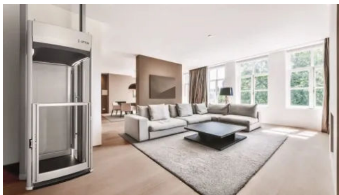
Homelift Lifton TRI0, Oberfläche hellgrau foliert