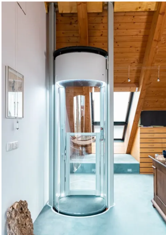
Homelift Lifton in Sondernform und -farbe