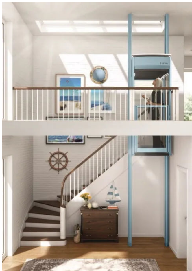
Homelift Lifton TRI0, Oberfläche blau foliert