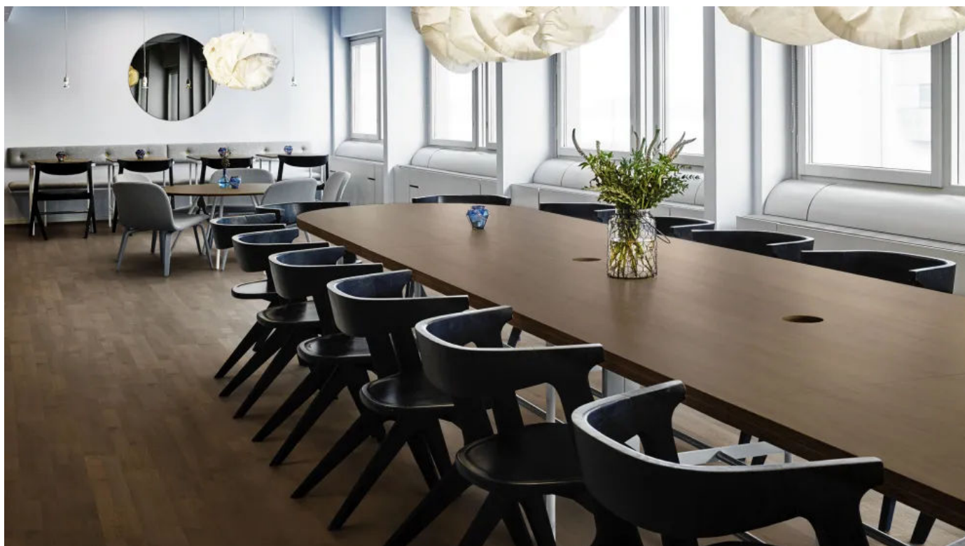
Kährs Life, Cocoa Bean

– Technische Information 2-Stab 193 x 1225 x 7 mm