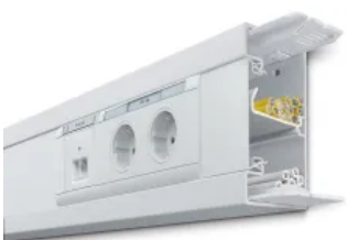
Brüstungskanalsystem Kunststoff halogenfrei

Die Brüstungskanalsysteme tehalit.BRN und tehalit.BR sind aus robustem Material gefertigt, lassen sich zeitsparend montieren und einfach nachinstallieren. tehalit.BR überzeugt mit seiner Angebotsvielfalt und dem variablen Geräteeinbau. Das Dreikammersystem des tehalit.BRN ermöglicht das getrennte Verlegen von Energie- und Datenleitungen.