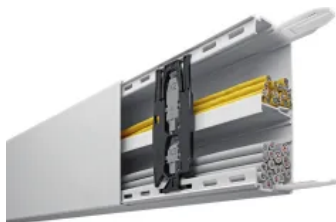
Leitungsführungssysteme Kunststoff halogenfrei

Als Leitungsführungssystem mit Geräteinbaumöglichkeit ist der tehalit.FB die Komplettlösung für gewerbliche Bauten. Er ist so robust, dass er den Beanspruchungen in Produktionsbetrieben, Werkstätten oder auch Laborgebäuden standhält. Die verfügbaren Geräteinbaudosen erlauben den Einbau von Standard- und CEE-Geräten. Ab einer Kanalbreite von 150 mm können an mehreren Positionen Trennwände eingesetzt werden, um Leitungen voneinander zu separieren.