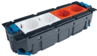
Gerätebecher und Einbaugeräte

Aus der Serie Leitungsführung und Raumanschlusssysteme von Hager Vertriebsgesellschaft