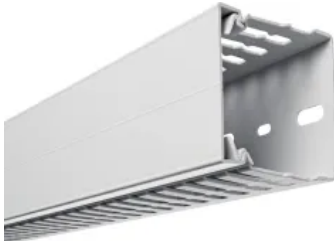
Verdrahtungskanalssysteme Kunststoff halogenfrei

Aus der Serie Leitungsführung und Raumanschlussysteme von Hager Vertriebsgesellschaft