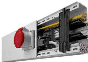
Leitungsführungssysteme Kunststoff mit Geräteinbaumöglichkeit

Das Leitungsführungssystem tehalit.LF macht die Montage durch diverse Formteile und integrierte, einrastende Kupplungen besonders leicht. Vormontierte Halteklammern helfen beim Einlegen der Leitungen. Bevorzugter Einsatzort: Kellerräume, Garagen, Gewerbe- und Industriebauten. Das System tehalit.LFW empfiehlt sich für Wohnräume. Der tehalit.LFR -Rollenkanal wird als 20-Meter-Rolle geliefert und erst auf der Baustelle zum Kanal geformt.