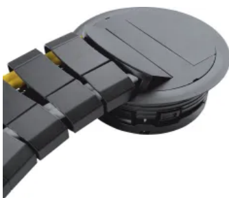
Doppel- und Hohlraumbodeninstallationssysteme

Bei Sanierungsobjekten oder in denkmalgeschützten Gebäuden ist ein Aufbodenkanal die geeignete Lösung. Das System electraplan.AK lässt sich durch die Auswahl an Formteilen leicht zusammenbauen. Auf die Kanalunterteile werden zum Fußboden hin abgeschrägte Blinddeckel geschraubt, die mit einem Bodenbelag versehen werden können. Montageöffnungen in der Abdeckung erlauben die Installation von Einbau- oder Versorgungseinheiten, von Bodenanschlussssäulen oder fußbodenübertragenden Zapfsäulen.