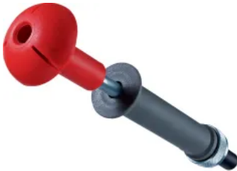
Verdrahtungskanalssysteme, Zubehör und Werkzeuge

In Funktion und Qualität stehen Verdrahtungskanalssysteme aus halogenfreiem Material den PVC-Varianten in nichts nach. Alle Systeme sind selbstverlöschend nach der Vorschrift UL94 und setzen keine Halogene frei, die in Verbindung mit Löschwasser aggressive Säuren erzeugen. Zusätzlich erfüllen tehalit.HA7 und tehalit.HNG-VO auch die Anforderungen an die elektrische Ausrüstung in Schienenfahrzeugen.