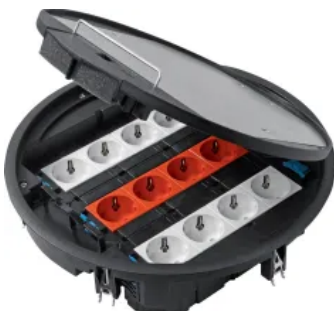
Versorgungs- und Einbaueinheiten

Eine flexible und elegante Installationslösung beim Neubau von Büroräumen und anderen gewerblich genutzten Gebäuden sind Systeme für Doppel- und Hohlraumböden. electraplan.DB-HB setzt auf vorkonfektionierte Leitungen und vorgefertigte Montageöffnungen im Boden. In die Öffnungen werden Versorgungseinheiten eingesetzt, die mit Gerätebechern und den gewünschten Geräten bestückt sind. Alle Komponenten sind aufeinander abgestimmt und müssen nur zusammengesteckt werden.