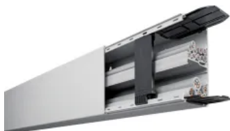
Leitungsführungssysteme Kunststoff UV-stabilisiert

Im Brandfall werden Folgeschäden vermieden, weil typische durch Halogene hervorgerufene chemische Reaktionen gar nicht erst auftreten – dadurch lassen sich die Sachschäden nach einem Brand gering halten. Als komplett halogenfreies Leitungsführungssystem erfüllt der tehalit.LFH / LFWH diese Kriterien und eignet sich für öffentliche Gebäude, in denen der Einsatz halogenfreier Kunststoffe verlangt wird.