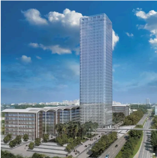
Uptown Büroturm München | Individuelle Steuerung mit LCN

Aus der Serie LCN - Das smarte Bussystem für alle Gebäudearten von ISSENDORFF- LCN Gebäudesteuerungen