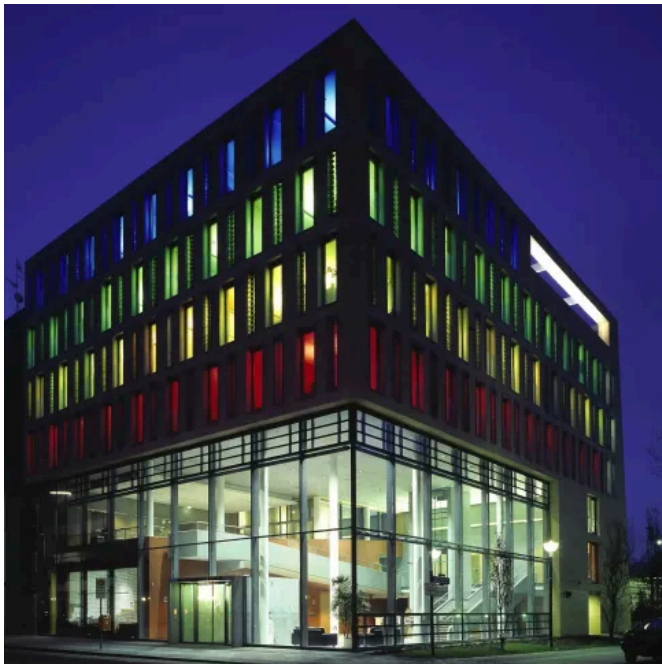
Ärztekammer Berlin | Umfangreiche Lichtfunktionen von LCN