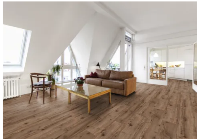
Laminat CLASSIC TOUCH K2596 Walnut Lago

Die Produktlinie Classic Touch integriert die strukturierte Oberfläche „Epic Grain“, die durch einen lebendigen Dekormix gekennzeichnet ist. Neben verschiedenen Eichenvarianten umfasst das Sortiment nun auch Dekore in Buche und Nussbaum. Beispiele hierfür sind die dezent gestaltete Eiche Castilla und die ausdrucksstarke Eiche Kansas. Beide Serien kombinieren natürliche Optik mit gestalterischer Vielfalt, wohnlicher Wirkung und einer verlegefreundlichen Konstruktion.