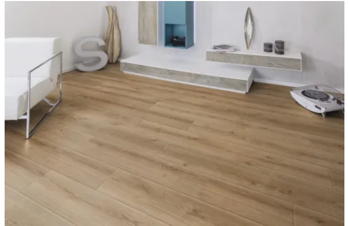
Laminat NATURAL TOUCH K4421