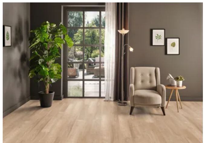
Laminat CLASSIC TOUCH K2730 Dakota Oak ERIE