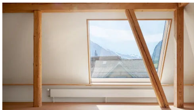
Klappdachfenster s: 211 E

Das Klappdachfenster lässt sich ab einem Winkel von 10 Grad unkompliziert und flächenbündig in bestehende oder neue Eternit-, Schindel- sowie alle Arten von Ziegeldächern einbauen – auch an unzugänglichen Stellen. Mit der Dachzarge s: 207 ist das s: 211 E in Flachdächer integrierbar. Die patentierten Ausführungen des Klappdachfensters s: 211 E entsprechen den neuesten energetischen Anforderungen: