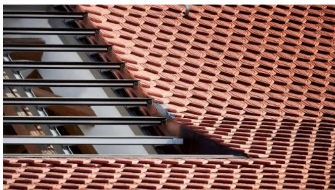
Lamellendachfenster s: 203

s: 203 NRWA-tauglich (Natürlicher Rauch-Wärme-Abzug)