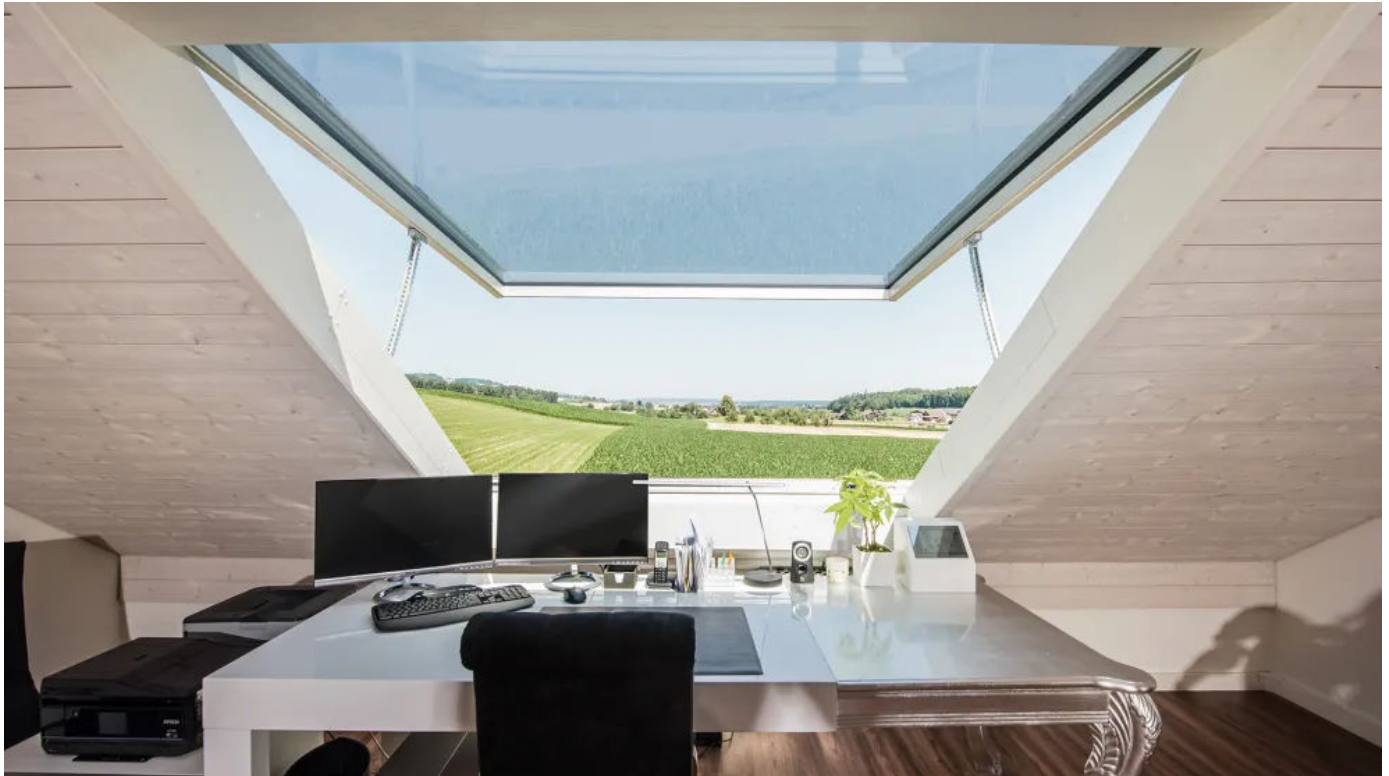
Klappdachfenster s: 211 E

Aus der Serie Dachfenster als Lamellenfenster, Klappdachfenster oder als Dachausstieg von stebler glashaus / kehrer stebler