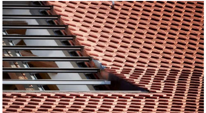
Lamellendachfenster s: 203

s: 203 NRWA-tauglich (Natürlicher Rauch-Wärme-Abzug)