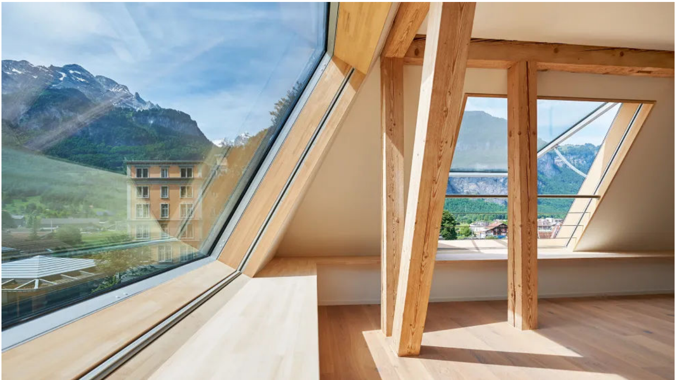
Klappdachfenster s: 211 E