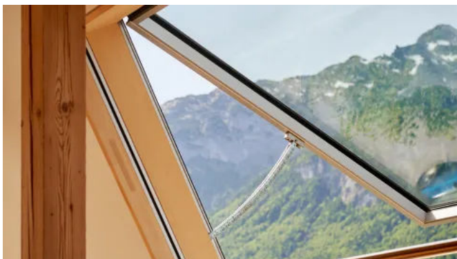
Klappdachfenster s: 211 E