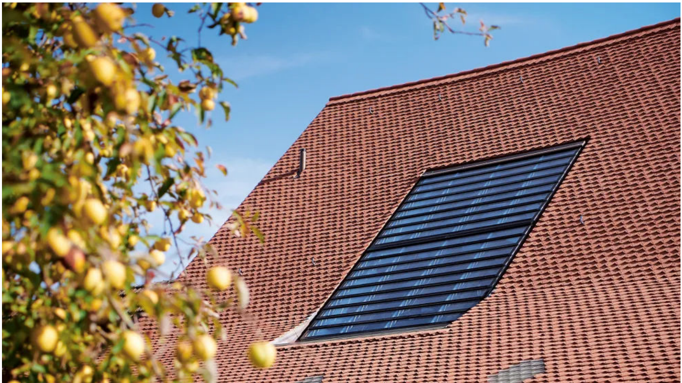
Lamellendachfenster s: 203