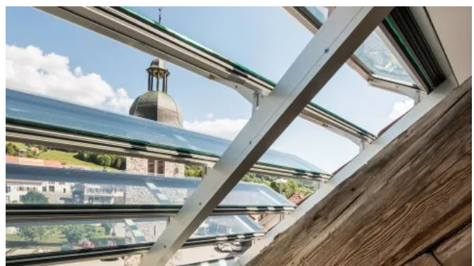
Lamellendachfenster s: 203

Die maximale Fenstergröße beträgt 15 m 2 .