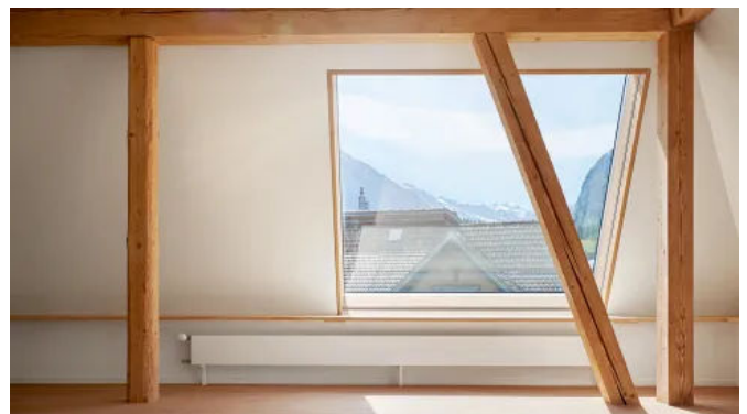
Klappdachfenster s: 211 E

Das Klappdachfenster lässt sich ab einem Winkel von 10 Grad unkompliziert und flächenbündig in bestehende oder neue Eternit-, Schindel- sowie alle Arten von Ziegeldächern einbauen – auch an unzugänglichen Stellen. Mit der Dachzarge s: 207 ist das s: 211 E in Flachdächer integrierbar. Die patentierten Ausführungen des Klappdachfensters s: 211 E entsprechen den neuesten energetischen Anforderungen: