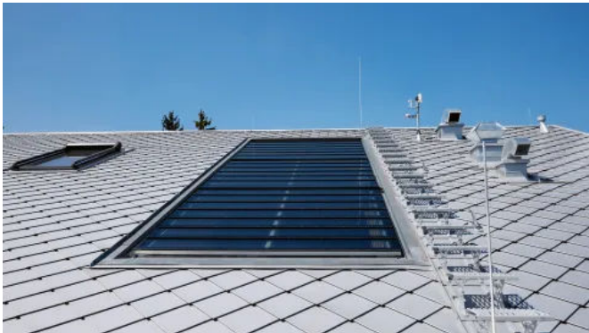
Lamellendachfenster s: 203

Innenbeschattungen, Mückengitter und LED-Beleuchtung können in der Umrandung unsichtbar eingelassen und wahlweise von Hand oder mit Motor bedient werden.