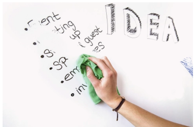
...und problemlos wieder gereinigt werden.

2K-Aqua Whiteboard 2384 ist eine wasserbasierte, zweikomponentige Polyurethan-Acrylbeschichtung. Dieses Spezialprodukt von Brillux verwandelt Wandflächen im Innenbereich in funktionale Whiteboards. Die Reinigungsfähigkeit beruht auf der besonders geschlossenen Oberfläche.