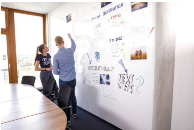
Die Whiteboardoberfläche kann mit speziellen Whiteboard-Markern beschriftet...