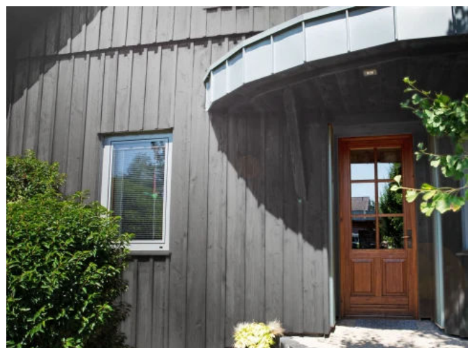
Mit Lignodur VarioGuard Tix 510 ist es möglich, eine einheitliche Imitation der natürlichen Vergrauung zu erzeugen.