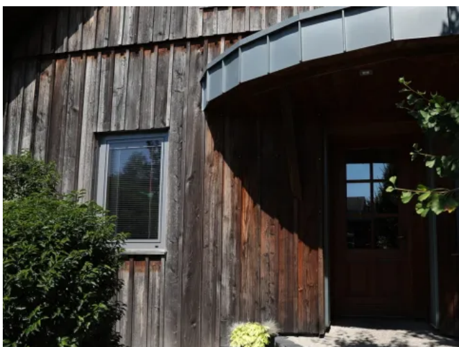
Das Erscheinungsbild der Holzfassade zeigt, dass sie ungeschützt und somit ungleichmäßig verwittert ist.

Im direkten Vergleich zeigt sich, wie die ungleichmäßige natürliche Vergrauung (links) mit Lignodur VarioGuard Tix 510 gleichmäßig imitiert werden kann (rechts). Das Holz ist durch den Beschichtungsfilm geschützt.