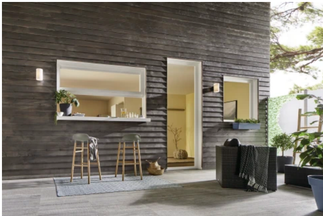
Das erweiterte Farbspektrum für Lignodur VarioGuard Tix 510 lässt Holzflächen edel altern.