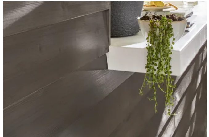
Das erweiterte Farbspektrum für Lignodur VarioGuard Tix 510 lässt Holzflächen edel altern.

Lignodur VarioGuard Tix 510 ist eine Alkydharzlasur und eignet sich für wetterbeständige Anstriche auf nicht maßhaltigen und begrenzt maßhaltigen Holzbauteilen aus Laub- und Nadelhölzern im Außen- und Innenbereich. Mit acht metallischen Lasurfarbtönen lässt sich die Optik von natürlich verwittertem Altholz gleichmäßig imitieren.