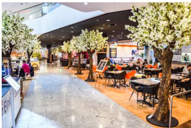
Kunstbaum "im Sommer" I (© Marco Flade)

ArtTree-Kunstbäume sind mehr als nur Dekoration – sie sind ein Statement. Mit ihrer natürlichen Ausstrahlung und echter Baumrinde am Stamm bringen sie die Natur in Räume, ohne dass ein Gärtner oder Sonnenlicht nötig ist. Durch das innovative Design kann das Blattwerk saisonal ausgetauscht werden: frische Blüten im Sommer, zarte Herbststöne oder beschneite Äste im Winter.