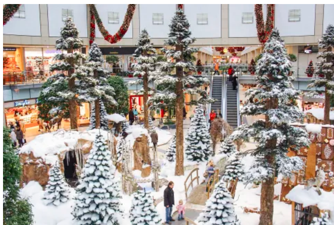
Kunstbaum "im Winter" I