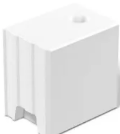
KS-Fasersteine (KS F) nach DIN V 106

Durch die umlaufende, abgeschrägte Fase an den Kanten des Steines und die Verlegung der Steine in Dünnbettmörtel, übernimmt die Fase die Funktion der klassischen Sichtfuge. Im Abstand von 12,5 cm sind im Mauerwerk Installationskanäle angeordnet, sodass alle Elektroleitungen direkt zu den Steckdosen, Schaltern und Lampen durchgezogen werden können, ohne dass die Wandoberfläche aufgeschlitzt bzw. zerstört werden muss.