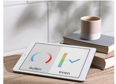
Kalksandstein schützt im Sommer vor Hitze, im Winter vor Kälte.