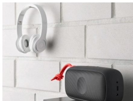
Kalksandstein schützt effektiv vor Lärm.