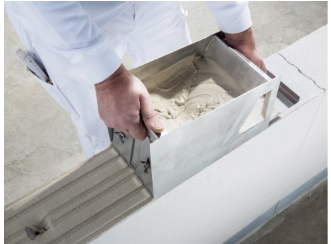
KS Plansteine werden mit Dünnebettmörtel "verklebt".