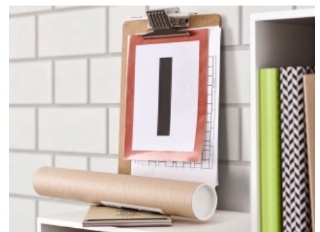
Kalksandsteinwände sind wahre Brandwände.