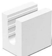
Fertigteilstütze (KS-FTS) und Flachstürze (KS-Flachsturz)

Produktübersicht: KS* Fertigteilstütze und KS* Flachstürze