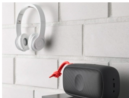
Kalksandstein schützt effektiv vor Lärm.