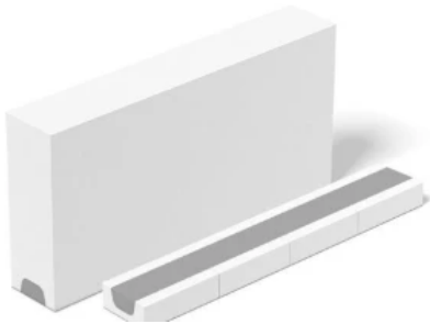
Fertigteilstütze (KS-FTS) und Flachstürze (KS-Flachsturz)