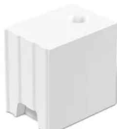
KS-R-Plansteine (KS-R P und KS L-R) nach DIN V 106