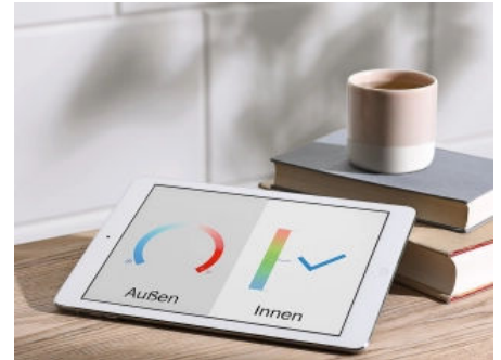
Kalksandstein schützt im Sommer vor Hitze, im Winter vor Kälte.