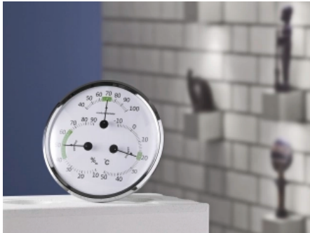
Kalksandstein reguliert die Luftfeuchtigkeit im Raum.

Aus der Serie KS Mauersteine aus Kalksandstein von KS-ORIGINAL