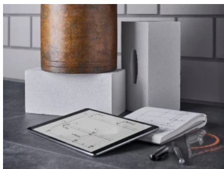
Kalksandstein hat eine hohe Druckfestigkeit.