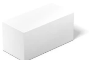
KS-Vollsteine (KS) und KS-Lochsteine (KS L) nach DIN V 106