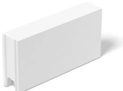
KS-Bauplatten (KS-P) nach DIN V 106