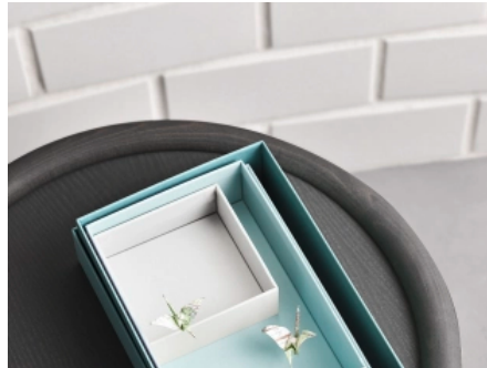
Kalksandstein ermöglicht Raumgewinn durch dünne Wände.