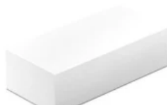
KS-Verblender (KS Vb) und KS-Vormauersteine (KS Vm) nach DIN V 106