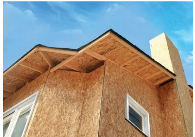
Anwendungsbeispiel OSB Platten