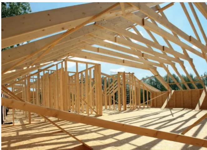
Anwendungsbeispiel OSB Platten