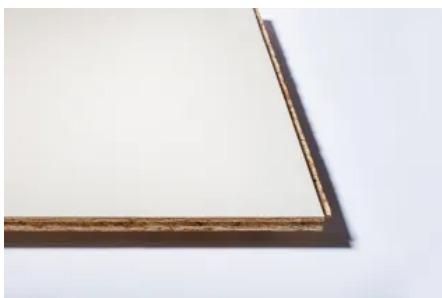
OSB Firestop N+F

Die OSB 3 Platte wird ein- oder beidseitig mit einer patentgeschützten brandschutzbeständigen Pyrotite® Oberflächenbehandlung versehen. Gegenüber den üblichen Holzwerkstoffplatten, verfügen OSB Firestop Platten über eine bessere Klassifikation in der Wertung der Reaktion auf Feuer. Gemäß der europäischen Klassifikation (EN 13501-1) wird die Klasse B-s1, d0 erreicht.