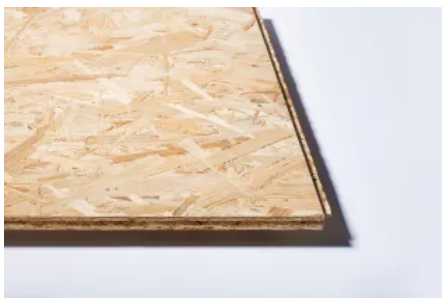
OSB 3 N+F

Holzwerkstoffplatte für tragende Zwecke mit Nut und Feder-Konstruktion