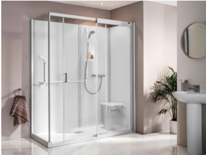
Kinemagic Royal + (© Stuart Rowen)

Aus der Serie Kinedo: Innovative Dusch- und Badlösungen von SFA Deutschland