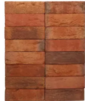
Terca Mistral Magmarot