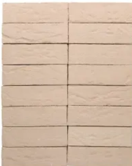
Terca Mistral Eifenbeinbeige

Terca Riemchen sind als NF-Riemchen (240 x 14 x 71 mm), NF-Winkelriemchen (240/115 x 14 x 71 mm) und NF-Läuferwinkelriemchen (240 x 14 x 71/115 mm) erhältlich.