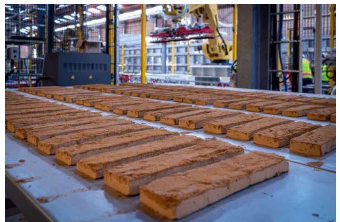
Terca Mistral Riemchen verbinden die Optik klassischer Handformziegel mit moderner, CO 2 -reduzierter Herstellung.

Terca Mistral Riemchen werden nicht aus Vormauerziegeln geschnitten, sondern eigenständig in einem präzisen Handformverfahren hergestellt. Die moderne, CO 2 -reduzierte Produktion verzichtet auf fossile Brennstoffe und brennt die Riemchen im elektrisch betriebenen Ofen. Durch den Einsatz erneuerbarer Energien im Trocknungs- und Brennprozess sowie durch Material- und Prozesseffizienz erreichen Terca Mistral Riemchen eine CO 2 -Reduktion von bis zu 85 % gegenüber herkömmlichen Riemchen. Durch die ausschließliche Verwendung von natürlichen, regional verfügbaren Rohstoffen und umweltverträglichen Pigmenten trägt Terca Mistral zum Klimaschutz bei.