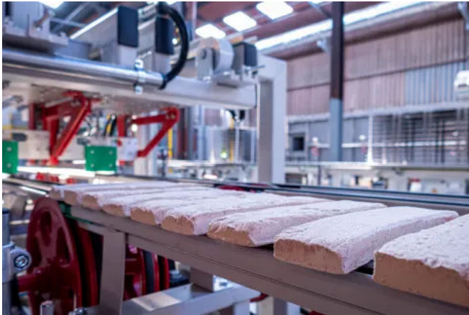
Terca Mistral Riemchen werden in einem weltweit ersten Handformverfahren hergestellt und im elektrischen Ofen gebrannt.

Aus der Serie Terca Fassadenlösungen von wienerberger