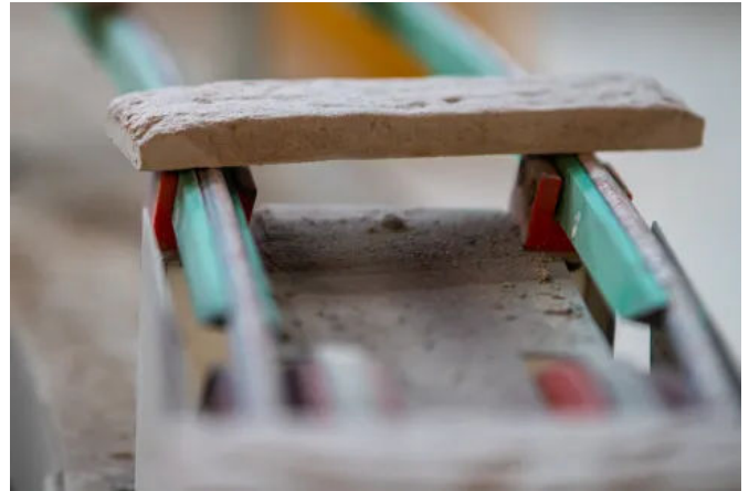
Das Produktionsverfahren kombiniert eine echte Handformpresse mit einer digitalen Engobierung und gezielten Besandung.