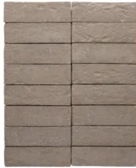
Terca Mistral Platingrau