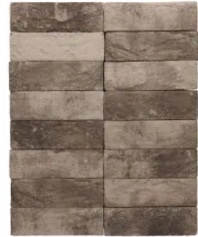
Terca Mistral Lavagrau