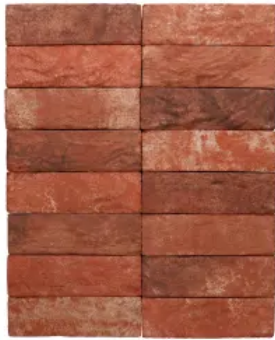
Terca Mistral Kupferrot

Aus der Serie Terca Fassadenlösungen von wienerberger