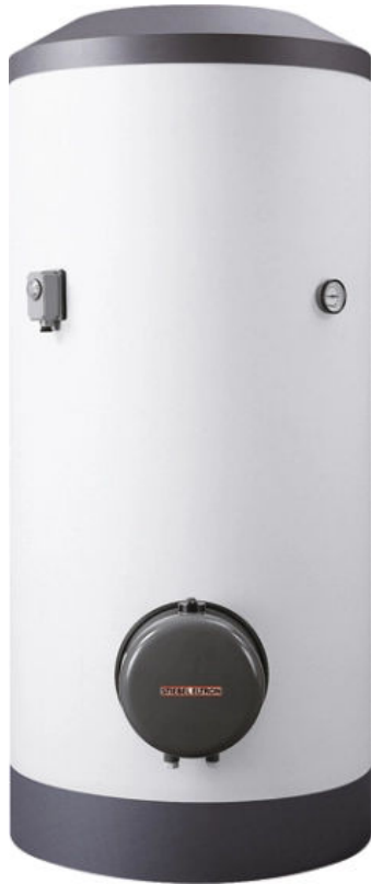
SHW mit Wärmeaustauscher

Aus der Serie Warmwasser von STIEBEL ELTRON