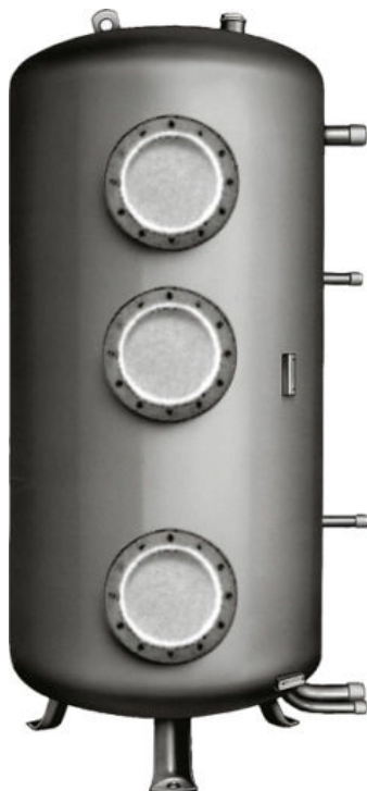
SB 650 / 3 AC

Für die Kombination bei großem Bedarf. Eine Wärmedämmung ist für den Speicher separat erhältlich.