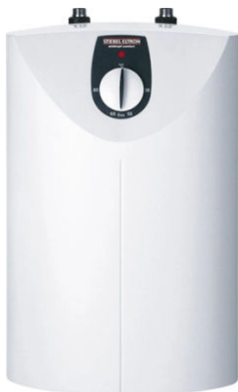
SNU SL Untertischmontage

Vollelektronischer Kleinspeicher für eine individuelle gradgenaue Einstellung der Wunschttemperatur. Drei auswählbare Zeitprogramme gewährleisten die Bereitstellung von warmem Wasser bei minimalem Energieverlust.