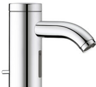
Armaturen für geschlossene Kleinspeicher

Wo Hygiene großgeschrieben wird, zum Beispiel in der Lebensmittelzubereitung, bei der Patientenversorgung oder in Sanitärbereichen, kommt die berührungslose Sensorarmatur zum Einsatz.