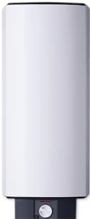
HFA / EB 80 Z

Die Wandspeicher HFA können als Einkreis-Zweikreis oder im Boilerbetrieb angeschlossen werden. Die Temperatur ist stufenlos von 35 bis 82 °C wählbar.