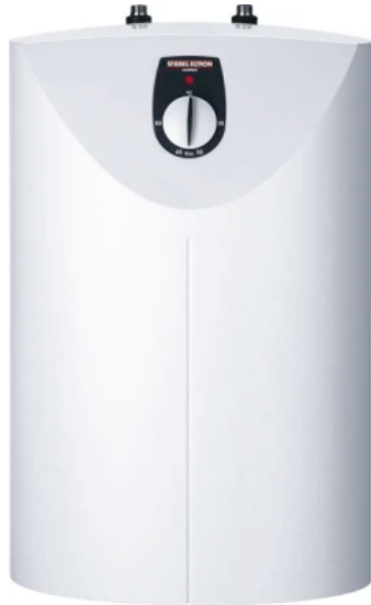
SHU SL Unterischmontage