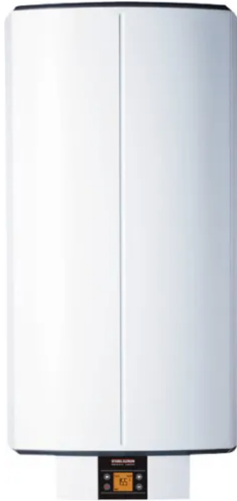
SHZ 30-150 LCD electronic comfort

Aus der Serie Warmwasser von STIEBEL ELTRON