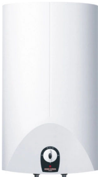
EB 15 SL