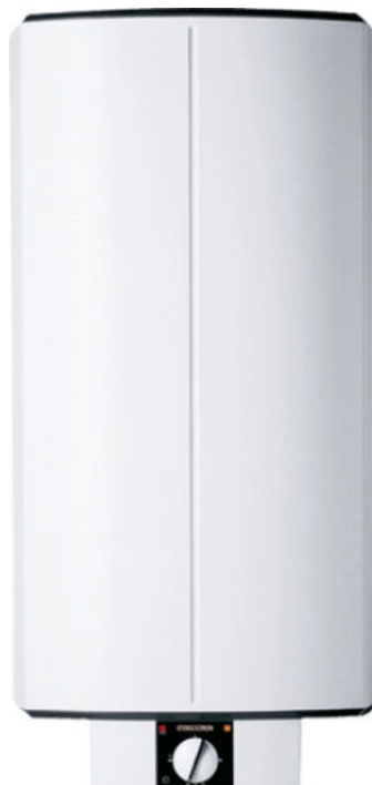
SHD 30 / 100 S