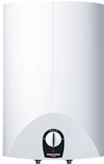
SH SL Übertischmontage

Mit einem druckfestem Innenbehälter für 5 oder 10 Liter Inhalt. In Verbindung mit der Sicherheitsgruppe SVMT kommen handelsübliche Druckarmaturen zum Einsatz.