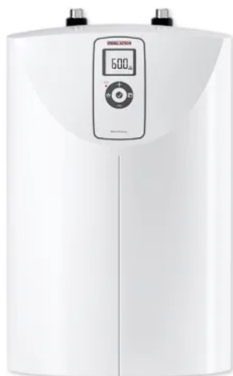
SNE 5 t ECO