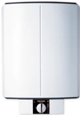
SH 30-150 S

Die Wandspeicher SHZ LCD electronic comfort liefern konstant warmes Wasser bei hoher Effizienz. Mit drei ECO-Funktionen lassen sich Effizienz und Warmwasserbereitung präzise auf den eigenen Bedarf abstimmen.