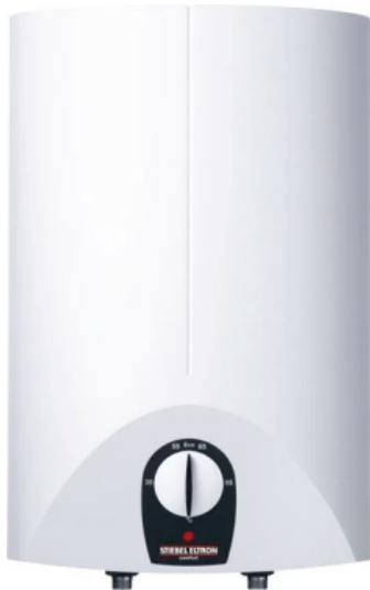
SN SL Übertischmontage

Aus der Serie Warmwasser von STIEBEL ELTRON