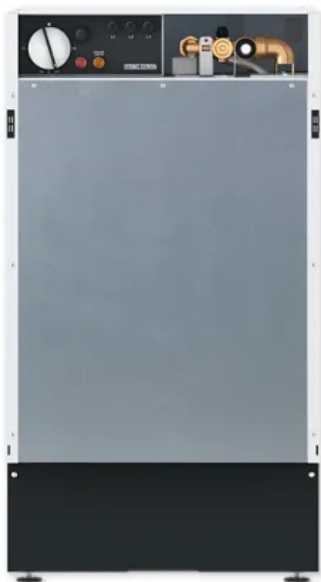
Küchen-Warmwasserspeicher HT 80 S

Der Tischspeicher HT 80 S lässt sich in jede Küchenzeile integrieren oder als Beistellgerät nutzen. Mit 80 Litern Inhalt versorgt er den Nutzer bedarfsgerecht und wirtschaftlich mit warmem Wasser - vom Geschirrspülen in der Küche bis zur Wanne im Bad. Dauerhaft auf Temperatur gehalten oder zum günstigen Nachtstromtarif erwärmt.