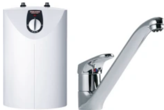
SNU 5 L und MAE-K

Kombiniert werden sie mit speziellen Wandarmaturen. Das Gerät ist in zwei Anschlussleistungen verfügbar.