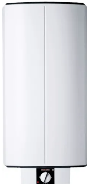
SNZ 80 S

Aus der Serie Warmwasser von STIEBEL ELTRON