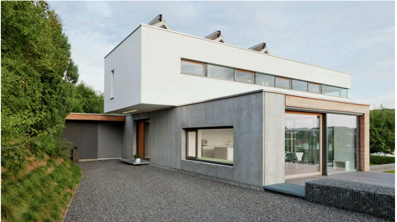
Einfamilienhaus in Pegnitz

Aus der Serie Silikat-Fassadenfarben und Anstrichsysteme von KEIMFARBEN