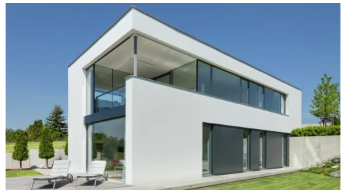
Privates Wohnhaus in Neustadt