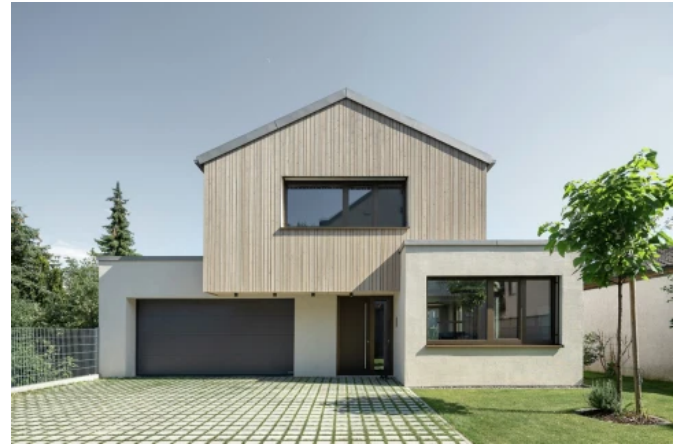
Munsky Häuser in Kandel

AquaROYAL®-Color ist eine hydrophile Silikatfarbe. Sie ist nicht wasserabweisend sondern gezielt so formuliert, dass anfallende Taufeuchtigkeit aufgenommen, teilweise in den Deckputz abgeleitet und dort zwischengespeichert werden kann. Entsprechend schnell erfolgt auch die Rücktrocknung. So kann die Oberfläche über lange Zeit trocken gehalten werden und ein Algen- oder Pilzbefall wird verringert. Schlagregen wird über den gesamten Systemaufbau abgewehrt. Dieser ist erprobt und funktioniert im genau definierten System mit aufeinander abgestimmten Komponenten.