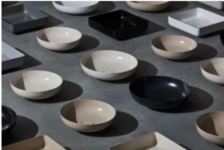
Die KALDEWEI Farbvielfalt ermöglicht die individuelle Gestaltung des Bades.