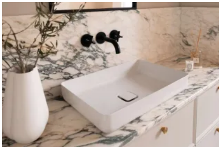
MIENA Waschtisch-Schalen