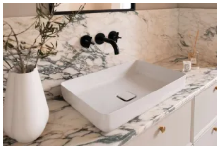
MIENA Waschtisch-Schalen