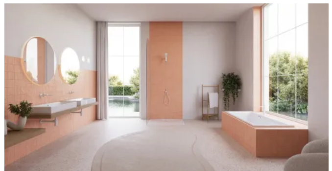
Badewanne und Waschtisch PURO