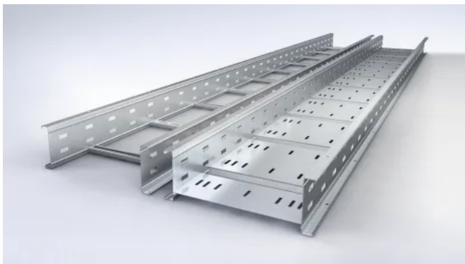
Weitspannsystem WPL/ WPR/ WL/ WLR