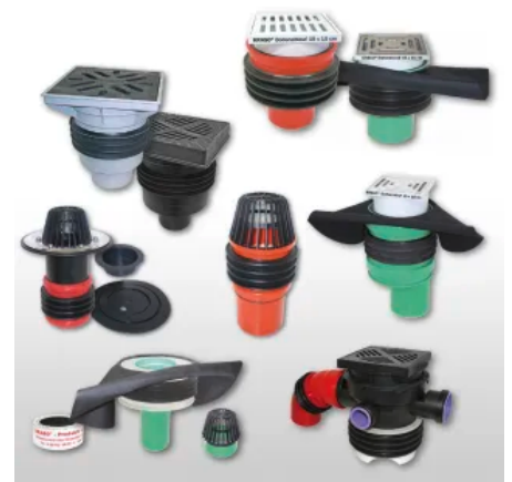
Boden-, Parkdeck- und Dachabläufe