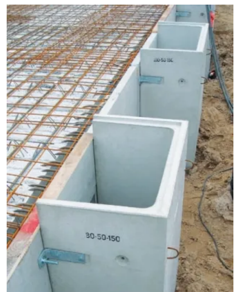
Anschraub-Lichtschacht ohne Dämmung

Kompaktlichtschächte KLS werden in 5 Bauhöhen angeboten: 70, 100, 120, 150 und 180 cm. Durch 15, 20 oder 25 cm hohe Aufsätze lassen sich die Höhen an die bauseitigen Anforderungen anpassen.