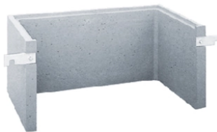
Anschraublichtschächte Typ AS