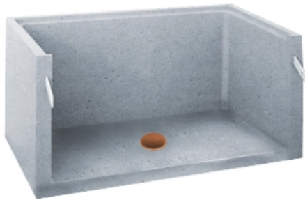
Einhängelichtschächte Typ D (Abbildung mit Boden)