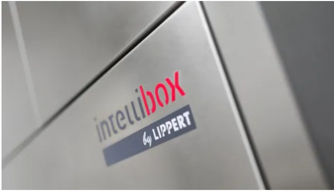
Intellibox® Mehrfachanlagen für Paketfächer

Aus der Serie Intelligente Paketstationen und Paketboxen von Lippert