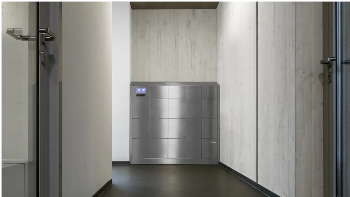
Intellibox® Mehrfachanlagen für Paketfächer