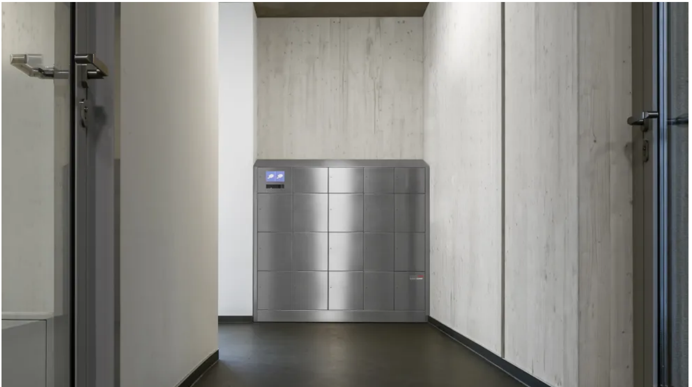
Intellibox® Mehrfachanlagen für Paketfächer