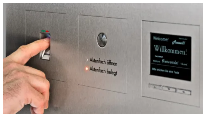
Paket-/Aktenfach mit Fingerscan