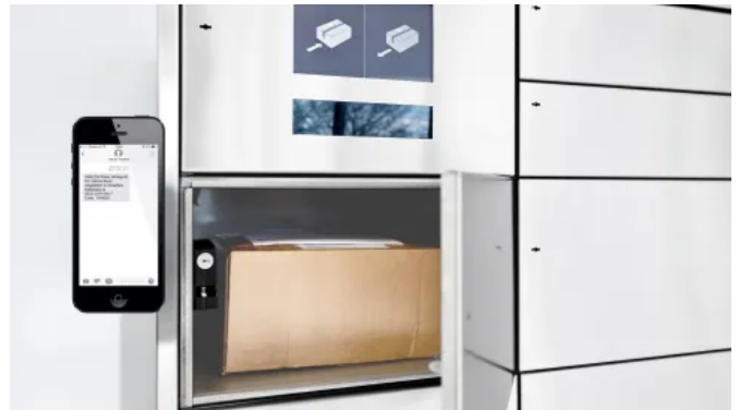
Intellibox® Mehrfachanlagen für Paketfächer