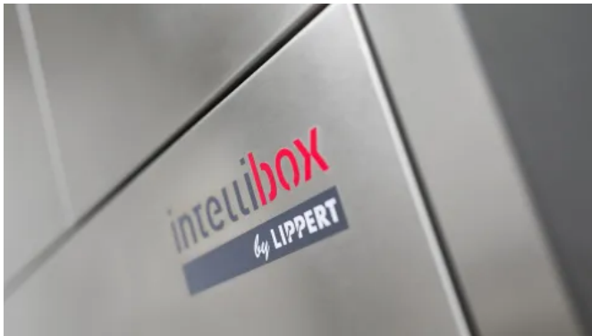
Intellibox® Mehrfachanlagen für Paketfächer

Aus der Serie Intelligente Paketstationen und Paketboxen von Lippert