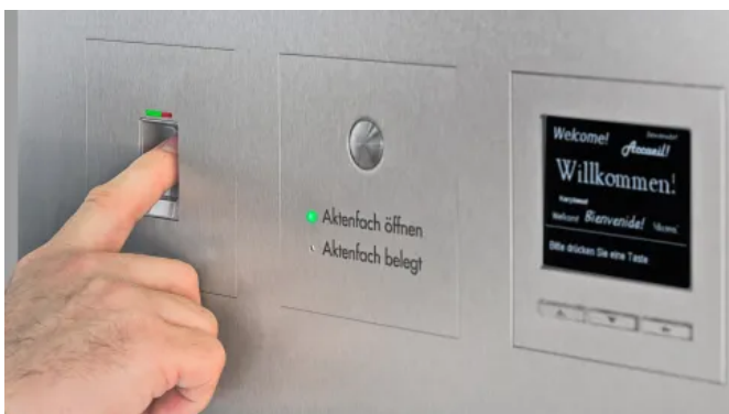
Paket-/Aktenfach mit Fingerscan öffnen