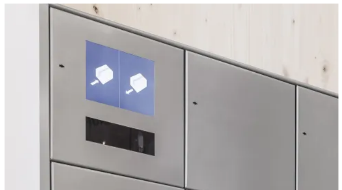
Intellibox® Mehrfachanlagen für Paketfächer