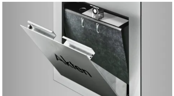
Intellibox® Einzelpaket- und Depottfächer