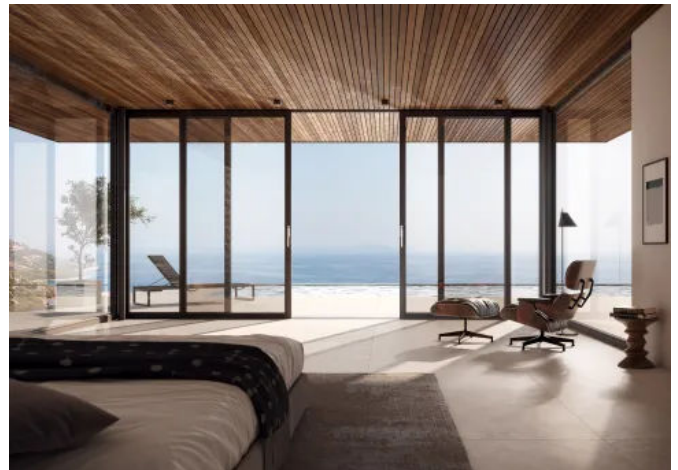
Luxus ohne Barrieren: primePort HS ist leicht zu bedienen und öffnet Räume großzügig ins Freie.

Der Beschlag primePort HS setzt neue Maßstäbe in Sachen Komfort und Barrierefreiheit. Speziell entwickelt für große Türelemente mit einem Gewicht von bis zu 440 kg, bietet er eine einfache Bedienung und eine stabile Konstruktion. Eine flache Schwelle sorgt für einen nahezu barrierefreien Zugang und das robuste System bietet optimale Sicherheit, inklusive einer möglichen Einbruchhemmung bis Widerstandsklasse RC2. Der ergonomische Griff und die intuitive Handhabung tragen ebenfalls zur hohen Benutzerfreundlichkeit bei und garantieren eine mühelose Bedienung.