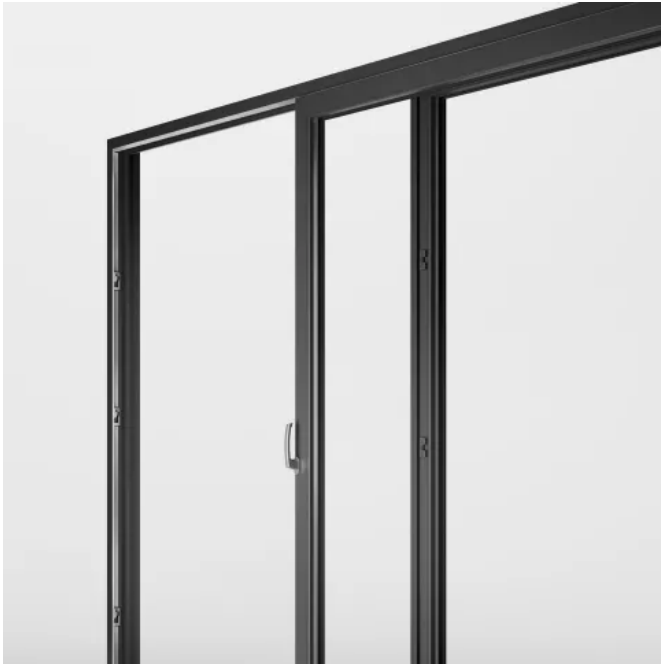
primePort AS: Platzwunder Abstell-Schiebe-Beschlag - Mehr Raum mit weniger Platz.

Aus der Serie Intelligente Fensterbeschlagtechnik für jede Anwendung von Aug. Winkhaus