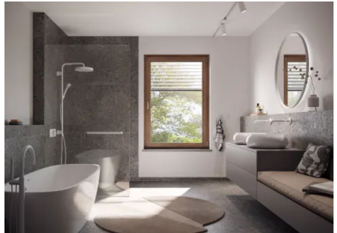
Winkhaus activPilot Comfort PADK , das Beschlagsystem mit Parallelabstell-, Dreh-, Kipp- und Schließfunktion.