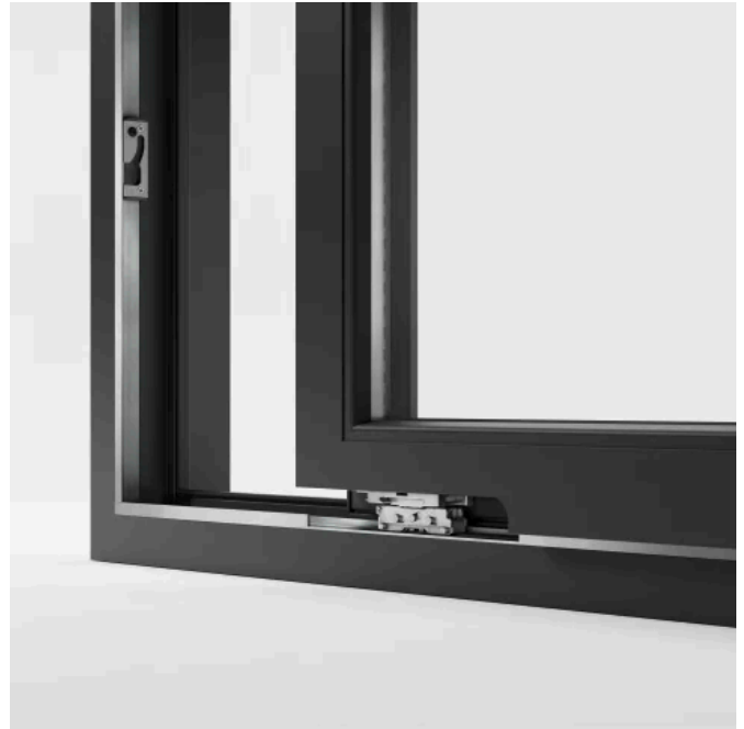
Der Laufwagen des primePort AS .