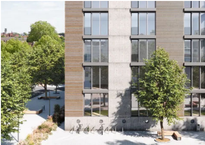
Kosten reduzieren durch einfache Montage: Winkhaus aluPilot , das effiziente Beschlagsystem für Aluminiumfenster.

Die verschiedenen innovativen Fenstersysteme von Winkhaus haben eine durchdachte Konstruktion und hohe Leistungsfähigkeit. Fensterbauer, Händler, Architekten, Bauherren und Anwender auf der ganzen Welt schätzen die erstklassige Material- und Verarbeitungsqualität der langlebigen Winkhaus Technik. Robuste Oberflächen gewährleisten Ästhetik und Funktionalität über viele Jahre hinweg.