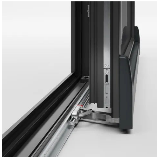
Der Laufwagen des primePort SK .