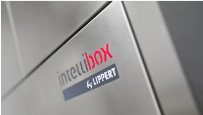
Intellibox® Mehrfachanlagen für Paketfächer

Aus der Serie Intelligente Paketstationen und Paketboxen von Lippert