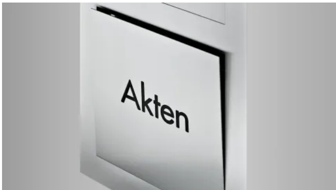
Intellibox® Einzelpaket- und Depottächer