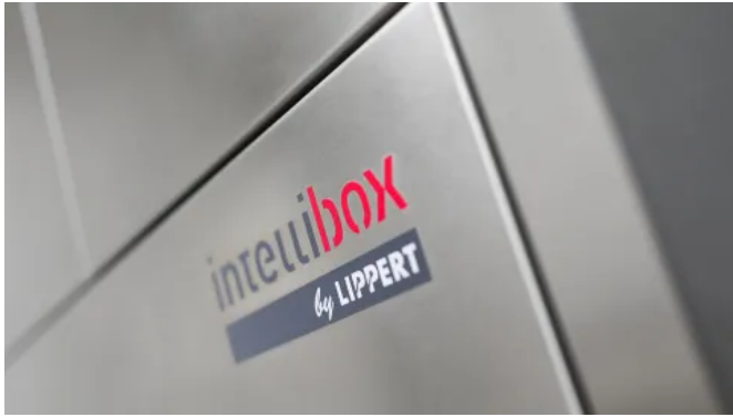
Intellibox® Mehrfachanlagen für Paketfächer

Aus der Serie Intelligente Paketstationen und Paketboxen von Lippert