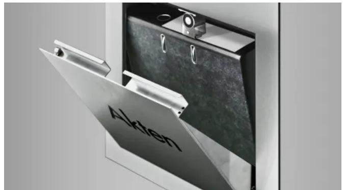
Intellibox® Einzelpaket- und Depottächer